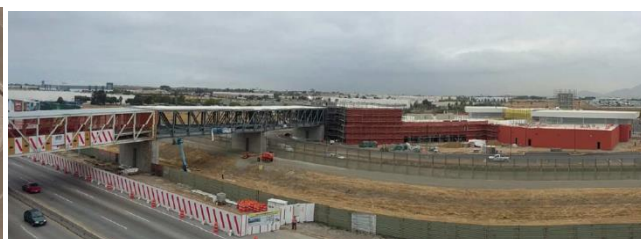
Conexión Peatonal Aeroportuaria Tijuana-San Diego