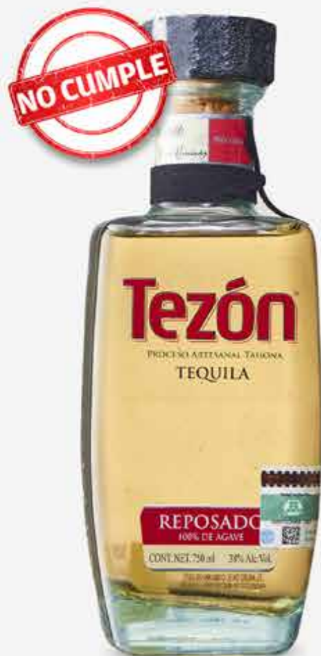
OLMECA TEZÓN Tequila reposado 100% agave / México / 750 ml

Recuerda que estos símbolos son obligatorios, por lo que al no ostentarlos el siguiente producto incumple la Norma Oficial*.