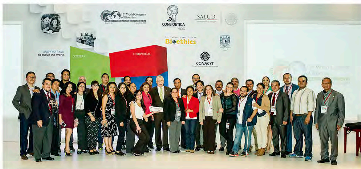
Colaboradores de la Comisión Nacional de Bioética

Asimismo, se hace un reconocimiento especial a cada uno de los colaboradores de la Comisión Nacional de Bioética cuya labor y compromiso se reflejó en el éxito de los eventos mundiales de 2014.