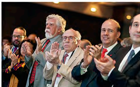
Asistentes a la sesión inaugural