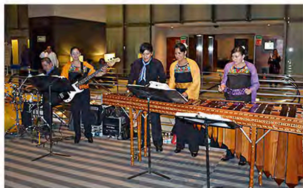
Marimba interpretando música tradicional