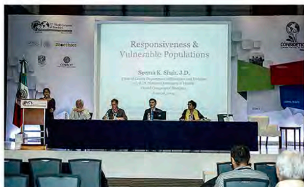
Participantes del simposio Responsiveness and vulnerable populations