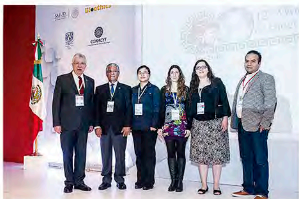
Ganadores de la Guillermo Soberón Travel Grant con el Presidente del Congreso