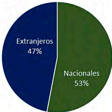
Asistentes al 12° WCB