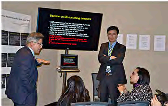
Presentación de la delegación de Corea

La dinámica consistió en que los representantes de las comisiones compartieran con sus colegas, en un ambiente académico y ameno, las experiencias, retos y cuestiones abordadas en sus instituciones. Dicho intercambio de ideas favoreció el diálogo intercultural sobre temas como: aspectos éticos en la investigación biomédica, cobertura universal en salud, difusión de la bioética para niños y jóvenes, consentimiento informado, dilemas al final de la vida, biodiversidad y medio ambiente, entre otros.