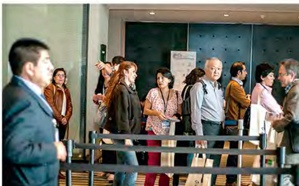
Registro al Congreso

En su décimo segunda edición, los asistentes al Congreso Mundial de Bioética presenciaron 30 conferencias magistrales, 50 simposios con 170 expertos internacionales, 290 presentaciones orales y 78 posters por parte de académicos, investigadores y estudiantes de pre y posgrado, así como profesionales de la salud.