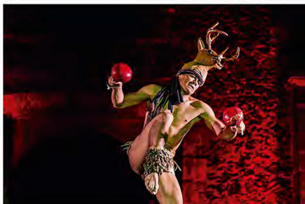
Danza del venado