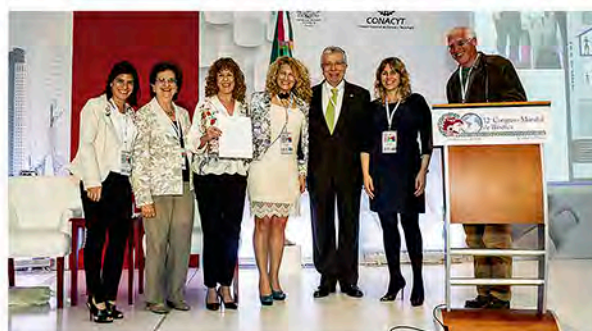
Ganadoras del tercer lugar del MH-PosterPrize