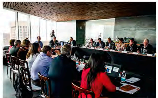
La XLVIII sesión del Consejo de la Comisión Nacional de Bioética

La sesión concluyó con la discusión de algunas dificultades en la creación y el mantenimiento de redes educativas en un contexto multicultural, para hacer frente a diferentes retos y establecer acuerdos de trabajo conjunto, teniendo en cuenta la situación compleja que representa el pensamiento religioso y los conflictos de interés. Cabe destacarse que es la primera vez que se da una reunión de esta importancia, en la que participen destacadas personalidades de la bioética en el contexto global.