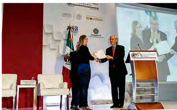
Ganadora del Mark S. Ehrenreich Prize in Healthcare Ethics Research 2014