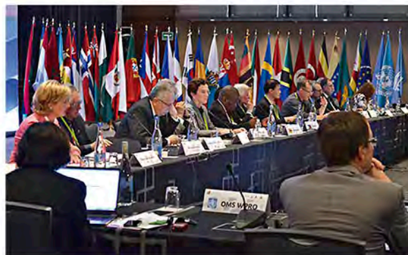
Sesión de Investigación en salud y los grupos en condiciones de vulnerabilidad