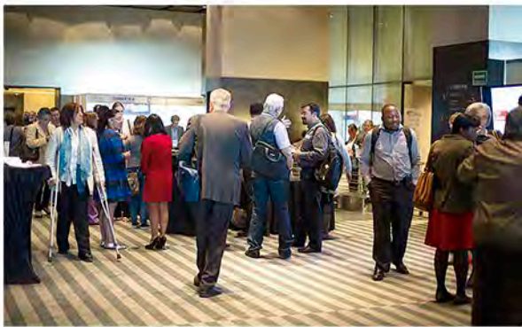
Primer día del Congreso