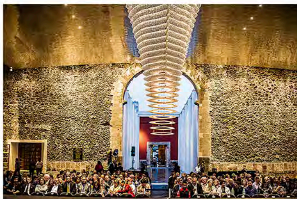
Biblioteca México, sede de la actividad cultural