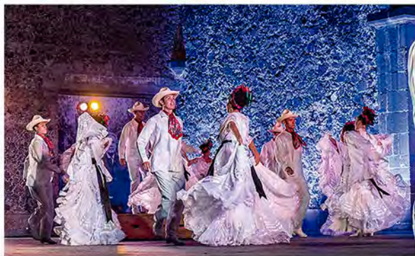
Ballet Folklórico de México de Amalia Hernández