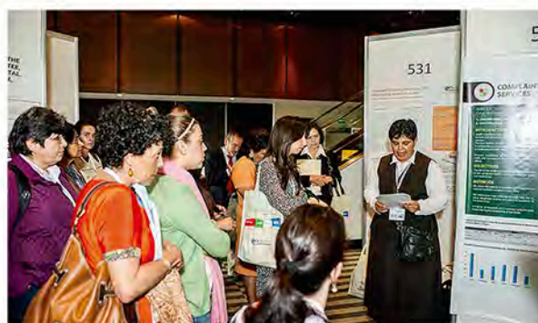
Presentación de posters