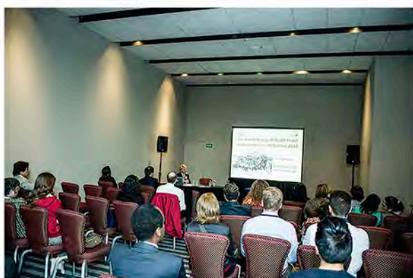
Sesión de la Red Iberoamericana de Bioética

Los ejes temáticos abordados en el Congreso fueron: