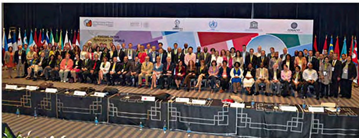
Delegados oficiales y asistentes de la 10ª Cumbre Global