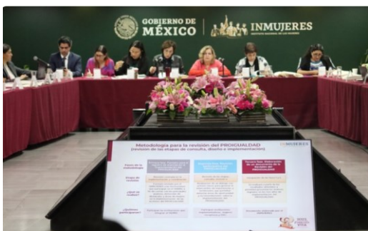
Realizada el 29 de noviembre de 2023 5