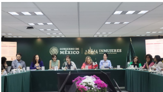
Realizada el 27 de abril de 2023 1