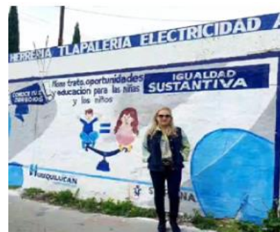
Imágenes proporcionadas por la SE SIPINNA Huixquilucan