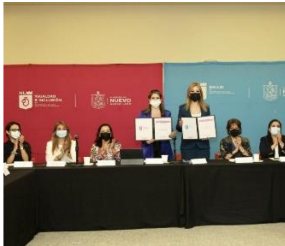
Instalación del Comité Estatal para el Desarrollo Integral Infantil de Nuevo León