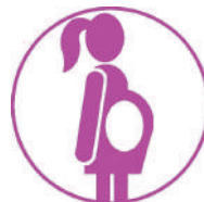
Embarazo en Adolescentes