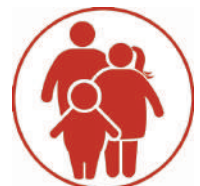
Obesidad y diabetes