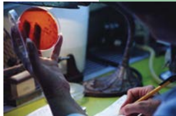
Los estudiantes serán responsables de los servicios de salud del país

mación indica que el volumen de estudiantes que debe ser formado en bioética es enorme. En unos años esta población será responsable de los servicios de salud del país, ya sea otorgando atención médica, organizando los programas y servicios, operando los programas de enseñanza o realizando investigación científica.