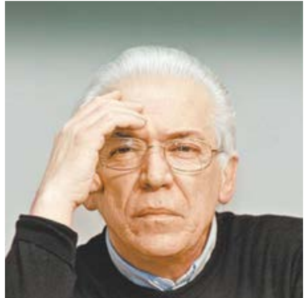
José María Pérez Gay

El 26 de mayo de 2013 murió en la ciudad de México José María Pérez Gay , escritor, ensayista y destacado narrador, así como traductor sobre todo del alemán y singular académico, quien fuera objeto de numerosos reconocimientos como el Premio Nacional de Periodismo en Divulgación Cultural en 1996; la Cruz de Honor para las Ciencias y las Artes, que otorga el Gobierno de Austria y la Orden de la Gran Cruz al Mérito por parte del gobierno de Alemania. Fue director fundador del Canal 22 y en diciembre pasado, la Universidad Iberoamericana le otorgó la medalla San Ignacio de Loyola.