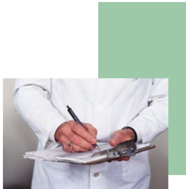
Es necesario un modelo conceptual para la enseñanza de la bioética

el conjunto, extensión, profundidad y organización de los conocimientos psicológicos, sociológicos, antropológicos, éticos y legales (...) directamente vinculados con el diagnóstico y tratamiento de las 20 patologías previamente determinadas.”. Es probable que los contenidos, profundidad y organización de la mayoría de las especialidades médicas deban estar vinculados a las 20 enfermedades más importantes para el médico general, pero esta no es la finalidad ni la riqueza que permite la enseñanza de la bioética.