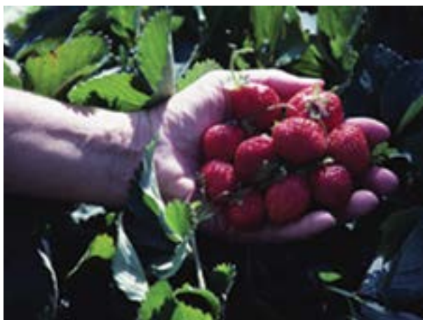
La bioética parte de la reflexión y análisis ético

En este contexto surgió la Bioética. Su discurso partió de la reflexión y el análisis ético sobre los múltiples y complejos dilemas que surgen de la relación de los seres humanos con el fenómeno de la vida en general y, con el de la vida humana en particular, que es en donde se inscribe la atención a la salud, así como la formación y educación de recursos humanos profesionales para ese fin.