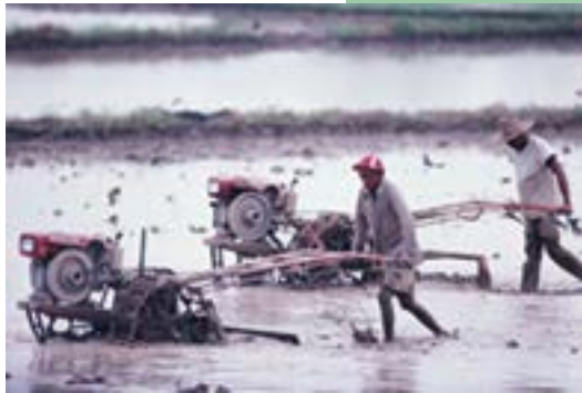
Es importante resolver problemas de derechos humanos y salud

mediante las facilidades que ha venido prestando y que se pueden observar en el apoyo a todas las actividades, revisión de problemas con problemas éticos, el establecimiento de iniciativas legislativas para resolver los problemas de salud con implicaciones éticas y todos aquellos en que se requiera la toma de decisiones que sean trascendentes en el ámbito de la defensa de los derechos humanos y de la salud.