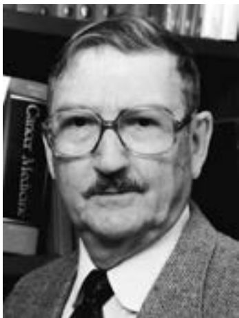
Van Rensselaer Potter

La bioética, como término, fue acuñada en 1927, sin embargo, para la mayoría de la población sigue siendo un término nuevo. Fritz Jahr fue el primero en empezar a hablar de ella en su artículo Bio-Ethik: Eine Umschau über die ethischen Beziehungendes Menschen zu Tier und Planze (Bio-Ética: una perspectiva de la ética de los seres humanos en relación con los animales y plantas) 1 , en éste, Jahr buscaba entablar una responsabilidad del hombre hacia el entorno, enfocándose en la fauna y la flora del medio que le rodea en el día a día. Años más tarde, en 1979, Van Rensselaer Potter retoma el concepto bioética como la ciencia de la supervivencia ante los avances científicos y tecnológicos en su publicación Bioethics: bridge to the future (Bioética: puente hacia el futuro) 2 . Es tras esta publicación que la bioética realmente comienza a tener relevancia, expandiéndose por el mundo ante los diferentes dilemas que enfrenta nuestros tiempos como consecuencia del incesante avance de la ciencia y la tecnología, así como de la aparente ruptura entre éstas y las humanidades.