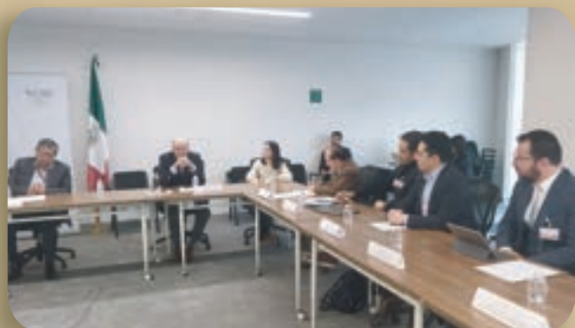
3ra Mesa de trabajo

Instituto Nacional de Electricidad y Energías Limpias (INEEL) y Comisión Nacional de Mejora Regulatoria (CONAMER).