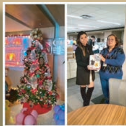
Tercer lugar piso 7

Con el fin de fortalecer el Clima Organizacional, se llevó a cabo durante el mes de diciembre un concurso en el cual se invitó a las distintas Áreas Administrativas a la decoración del árbol navideño en cada uno de los pisos. Para escoger a los ganadores, se conformó un jurado quienes evaluaron distintos factores como: creatividad, luces y colores, estética, originalidad, tamaño y ambientación. Posterior a la votación, resultaron ganadores los siguientes: