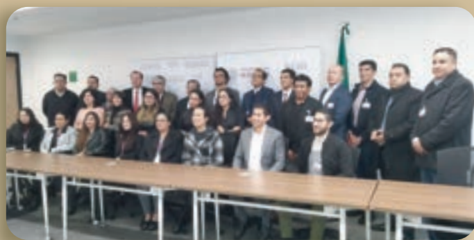
4ta Mesa de trabajo