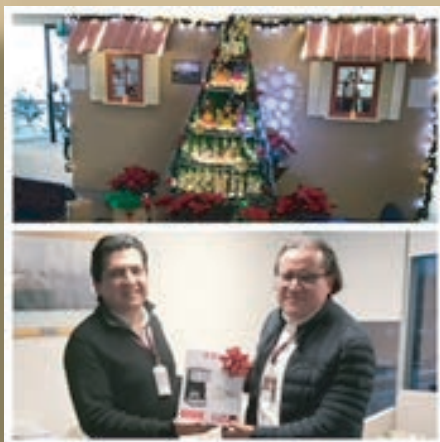
Primer lugar piso 8