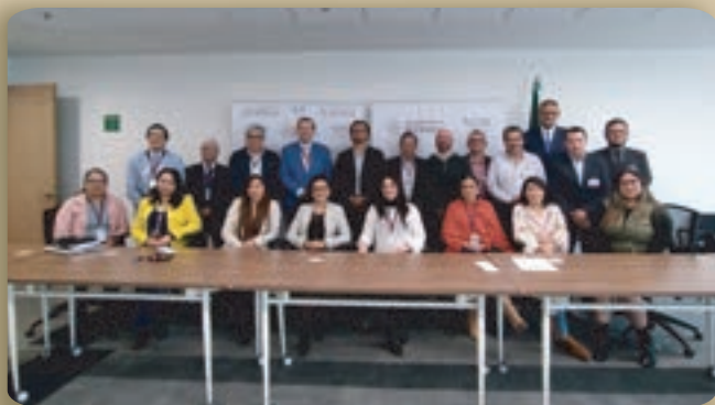
2da Mesa de trabajo