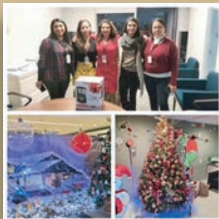
Segundo lugar piso 10 y 12