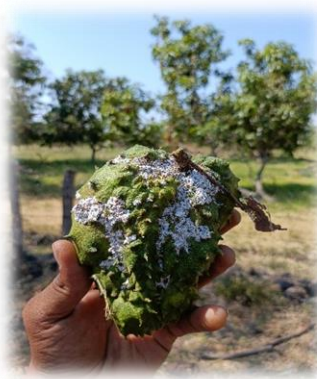
Figura 1. Fruto de guanábana con presencia de cochinilla rosada. CESAVEMICH, 2023.

Capacitaciones. Con el propósito de capacitar a técnicos y productores, así como difundir la información correspondiente a la campaña contra la cochinilla rosada.