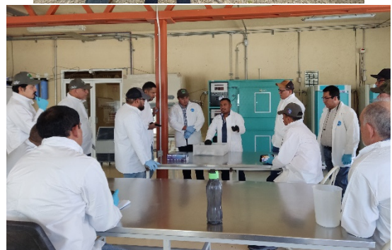
Img. 1. Misión Técnica del OIRSA a Unidades de Producción de Planta Sana de Cítricos Certificados en México