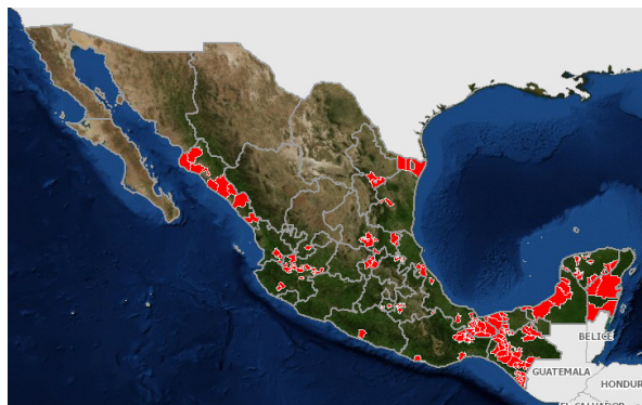
Figura 2. Estatus fitosanitario de Leprosis en México.