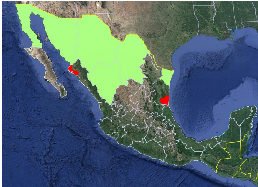
Fig.1.- Áreas libres de gusano rosado ( Pectinophora gossypiella ), en el 2024.

Al mes de febrero del 2024, las Entidades con reconocimiento oficial de zona libre de gusano rosado y picudo del algodón conservaron su estatus. Para el caso de gusano rosado corresponde a las entidades de Baja California, Sonora, Chihuahua, Coahuila, Durango y los municipios de Matamoros, Méndez, Río Bravo, Reynosa, San Fernando y Valle Hermoso del estado de Tamaulipas ( Fig.1 ). Asimismo, respecto al picudo del algodón, las entidades de Baja California y Chihuahua, los municipios de Altar, Caborca, General Plutarco Elías Calles, Pitiquito y San Luis Río Colorado de la Entidad federativa de Sonora, y el municipio de Sierra Mojada, Coahuila ( Fig.2 ).