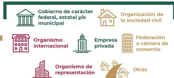
Ilustración 1 Tipos de actores que integran Pre-NODESS