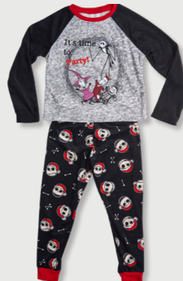
DISNEY TIM BURTON'S THE NIGHTMARE BEFORE CHRISTMAS 3535 D023L10510JK