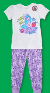
MY LITTLE PONY Estilo: 831VZ