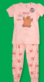
CN WE BARE BEARS Estilo: 829UX