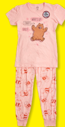
CN WE BARE BEARS Estilo: 829UX

Dos modelos calificaron como Suficiente, ya que sufrieron un encogimiento de entre el 6% y el 11%, el cual ya es notable.