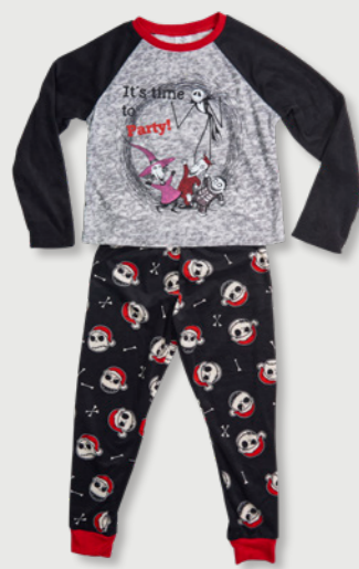
DISNEY TIM BURTON'S THE NIGHTMARE BEFORE CHRISTMAS 3535 D023L10510JK

Presentan variaciones en el contenido de fibras del elástico, fuera de la tolerancia de la norma de referencia (+ 3% sobre el valor declarado) respecto a lo que indican en su etiqueta, sin que sea grave.