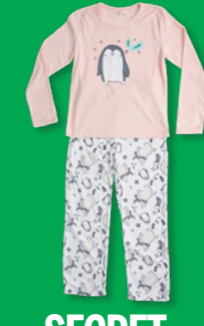
SECRET TREASURES GIRLS Estilo: G023L11601