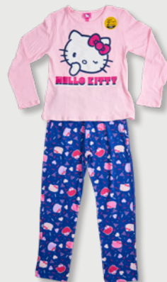
HELLO KITTY D023L10509HK