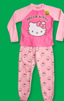
HELLO KITTY D023L09358HK