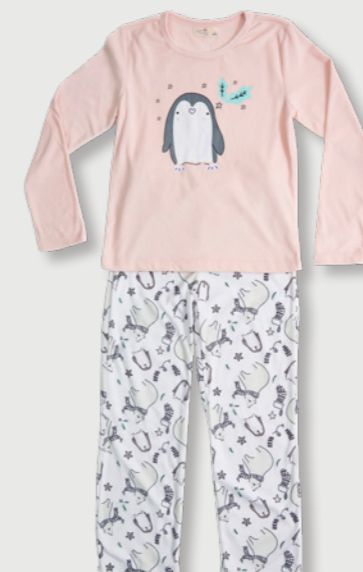
SECRET TREASURES GIRLS Estilo: G023L11601