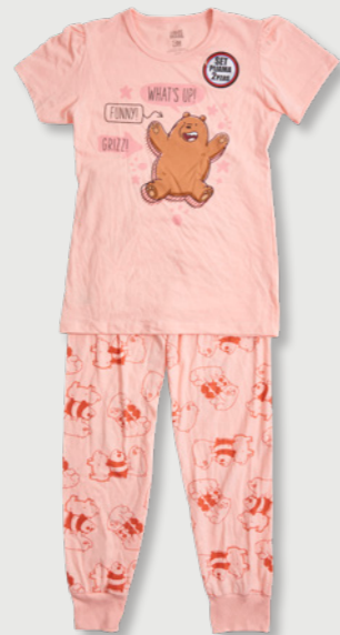
CN WE BARE BEARS Estilo: 829UX