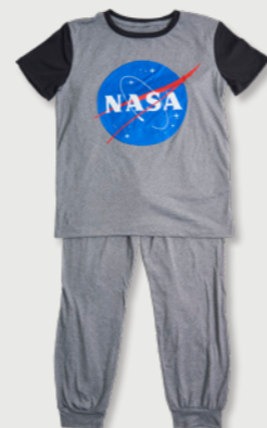
SPACE EXPLORING 27230706