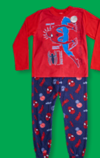
MARVEL SPIDER-MAN D023K1007S