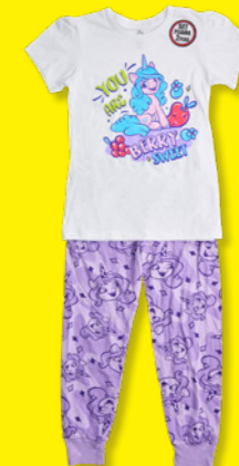
MY LITTLE PONY Estilo: 831VZ