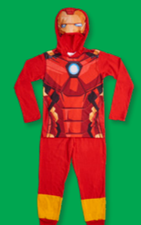
MARVEL AVENGER Estilo: T52308