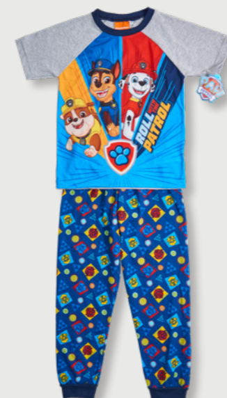
PAW PATROL T52301