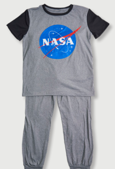
SPACE EXPLORING 27230706