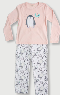
SECRET TREASURES GIRLS estilo G023L11601