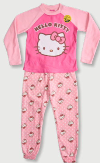
HELLO KITTY D023L09358HK