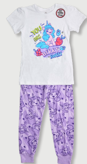
MY LITTLE PONY Estilo: 831VZ