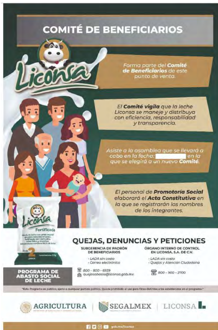
“Cartel de Comité de Beneficiarios”

Cartel que se entrega en cada punto de venta de leche en polvo para informar a los beneficiarios y/o público en general sobre los requisitos para incorporarse al Comité de Beneficiarios.