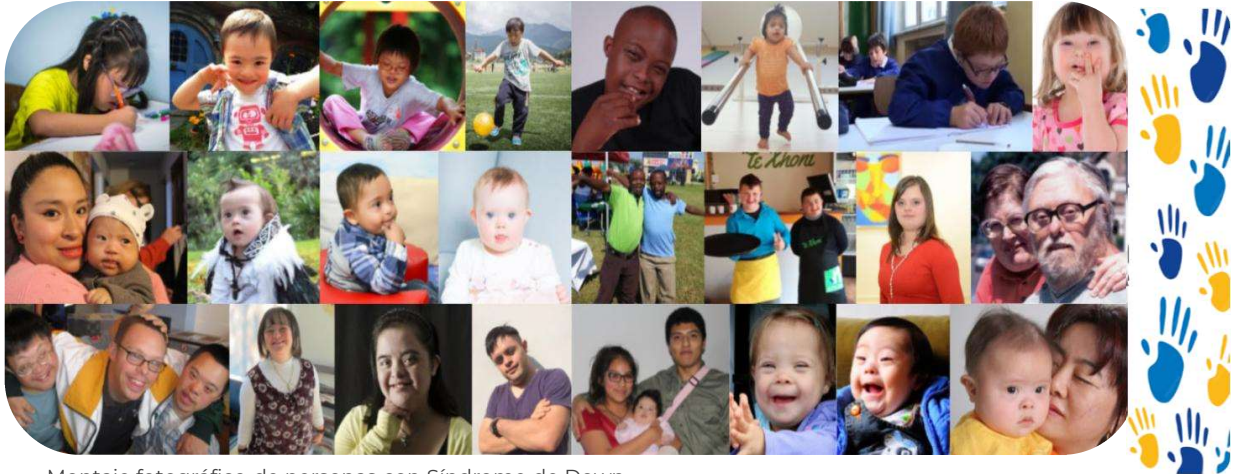
Montaje fotográfico de personas con Síndrome de Down

Las personas con síndrome de Down muchas veces son discriminadas, aun teniendo los mismos derechos que todas y todos. Con nuestro apoyo podrán vivir una vida plena y desenvolverse óptimamente en la sociedad'.