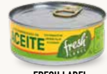
FRESH LABEL Atún desmenuzado en aceite / México / 140 g