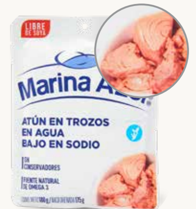
MARINA AZUL Atún en trozos en agua Bajo en sodio / México / 180 g