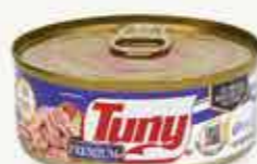
TUNNY PREMIUM Atún aleta amarilla en trozos en agua / México / 140 g

Rebasó el 30% de la proporción de hojuelas que establece la norma para denominarse atún en trozos, ya que tuvo de 34.6 a 37.2% .