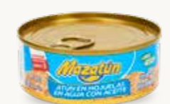
MAZATÚN Atún en hojuelas en agua con aceite / México / 130 g