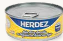
HERDEZ Atún aleta amarilla en Hojuelas en Aceite con agua / México / 130 g