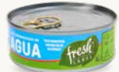
FRESH LABEL Atún desmenuzado en agua / México / 140 g