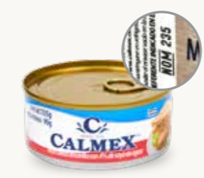
CALMEX Atún aleta amarilla con 4% de soya en agua / 135 g

Cuando un producto presenta el distintivo de cumplimiento de alguna Norma Oficial Mexicana debe comprobar su uso. Los siguientes productos no comprobaron el uso del símbolo distintivo de la NOM-235. 8