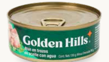
GOLDEN HILLS Atún en trozos en aceite con agua / México / 130 g

Indican: Aceite con agua → En realidad contienen: Agua con aceite