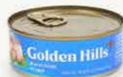
GOLDEN HILLS Atún en trozos en agua / México / 130 g

Rebasó el 30% de la proporción de hojuelas que establece la norma para denominarse atún en trozos, ya que tuvo 41.7% .