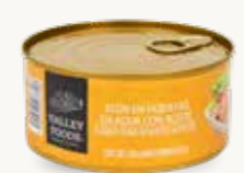
VALLEY FOODS Atún en hojuelas en agua con aceite / México / 295 g