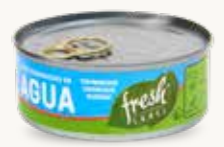
FRESH LABEL Atún desmenuzado en agua / México / 140 g