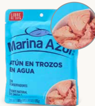
MARINA AZUL Atún en trozos en agua / México / 180 g

La imagen en sus etiquetas (atún sólido) no corresponden a sus presentaciones (atún en trozos), por lo que no son veraces.