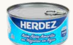
HERDEZ Atún aleta amarilla en Hojuelas en Agua / México / 280 g