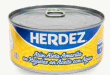
HERDEZ Atún aleta amarilla en Hojuelas en Aceite con agua / México / 280 g