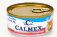
CALMEX Atún aleta amarilla con 4% de soya en agua / México / 135 g