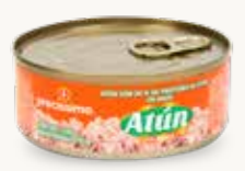
PRECISSIMO Atún con 30% de proteína en agua / México / 140 g