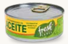
FRESH LABEL Atún desmenuzado en aceite / México / 140 g