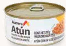
AURRERA Atún con 14% de soya en agua con aceite / México / 295 g