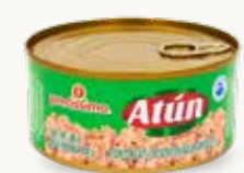
PRECISSIMO Atún con 30% de soya en agua con aceite / México / 285