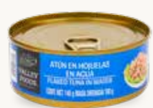
VALLEY FOODS Atún en hojuelas en agua / México / 140 g