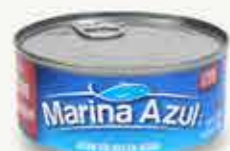
MARINA AZUL PREMIUM Atún sólido en agua / México / 270 g

Rebasó el 18% de la proporción de hojuelas y trozos que establece la norma para denominarse atún sólido, ya que tuvo de 20.5 a 21.6% .