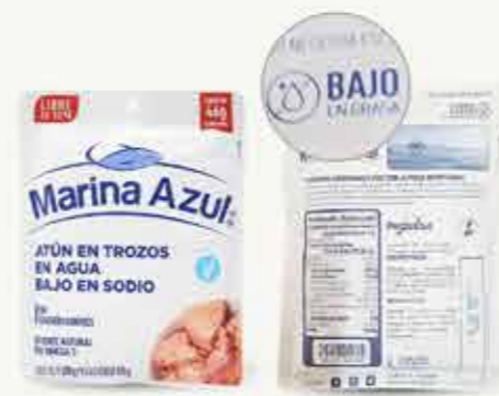
MARINA AZUL Atún en trozos en agua bajo en sodio / México / 180 g

Al frente del empaque indican "Atún en trozos en agua" y al reverso "Bajo en grasa", incumpliendo la NOM-235, pues toda la denominación debe indicarse al frente "Atún en trozos en agua bajo en grasa".