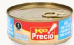
KE PRECIO! Atún con 14% de proteína de soya en agua / México / 130 g