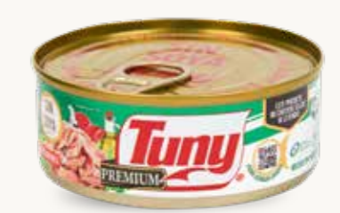
TUNY PREMIUM Atún aleta amarilla en trozos en aceite con agua / México / 140 g