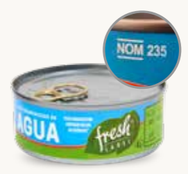
FRESH LABEL Atún desmenuzado en agua / México / 140 g