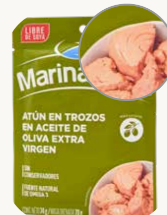
MARINA AZUL Atún en trozos en aceite de oliva extra virgen / México / 74 g