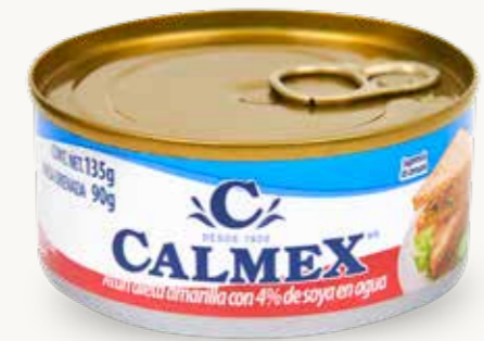
CALMEX Atún aleta amarilla con 4% de soya en agua / México / 135 g