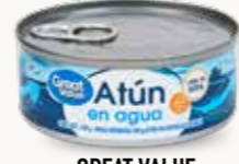
GREAT VALUE Atún en hojuelas en agua / México / 140 g