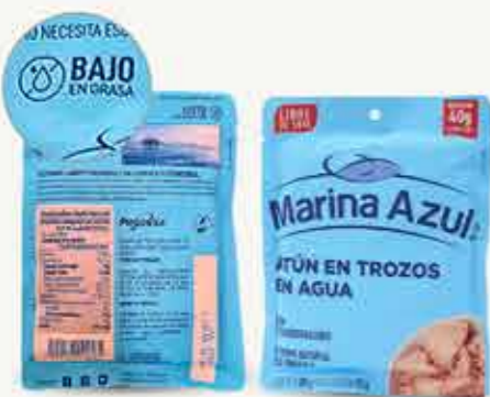
MARINA AZUL Atún en trozos en agua / México / 180 g

Al frente del empaque indican "Atún en trozos en agua" y al reverso "Bajo en grasa", incumpliendo la NOM-235, pues toda la denominación debe indicarse al frente "Atún en trozos en agua bajo en grasa".