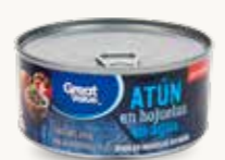
GREAT VALUE Atún en hojuelas en agua / México / 295 g