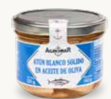
AGROMAR Atún Blanco sólido en aceite de oliva / España / 230 g