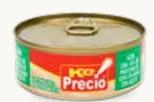
KE PRECIO! Atún con 14% de proteína de soya en agua con aceite / México / 140 g