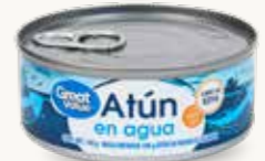
GREAT VALUE Atún en hojuelas en agua / México / 140 g