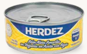
HERDEZ Atún aleta amarilla en Hojuelas en Aceite con agua / México / 130 g

Indican: Aceite con agua → En realidad contienen: Agua con aceite