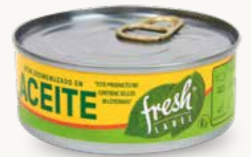
FRESH LABEL Atún desmenuzado en aceite / México / 140 g

Indica: Aceite → En realidad contiene: Agua con aceite