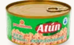
PRECISSIMO Atún con 30% de soya en agua con aceite / México / 285 g