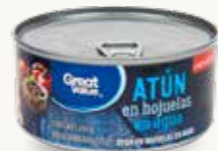
GREAT VALUE Atún en hojuelas en agua / México / 295 g