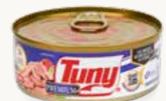
TUNY PREMIUM Atún aleta amarilla en trozos en agua / México / 140 g