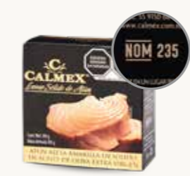
CALMEX Atún aleta amarilla sólido en aceite de oliva extra virgen / 140 g