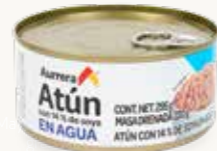
AURRERA Atún con 14% de soya en agua / México / 295 g