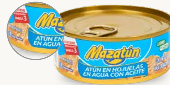
MAZATÚN Atún en hojuelas en agua con aceite / México / 130 g

La imagen en su etiqueta (atún sólido) no corresponde a su presentación (atún en hojuelas), por lo que no es veraz.