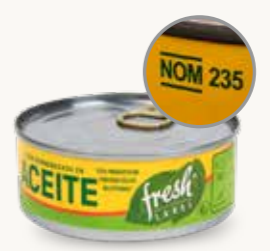
FRESH LABEL Atún desmenuzado en aceite / México / 140 g