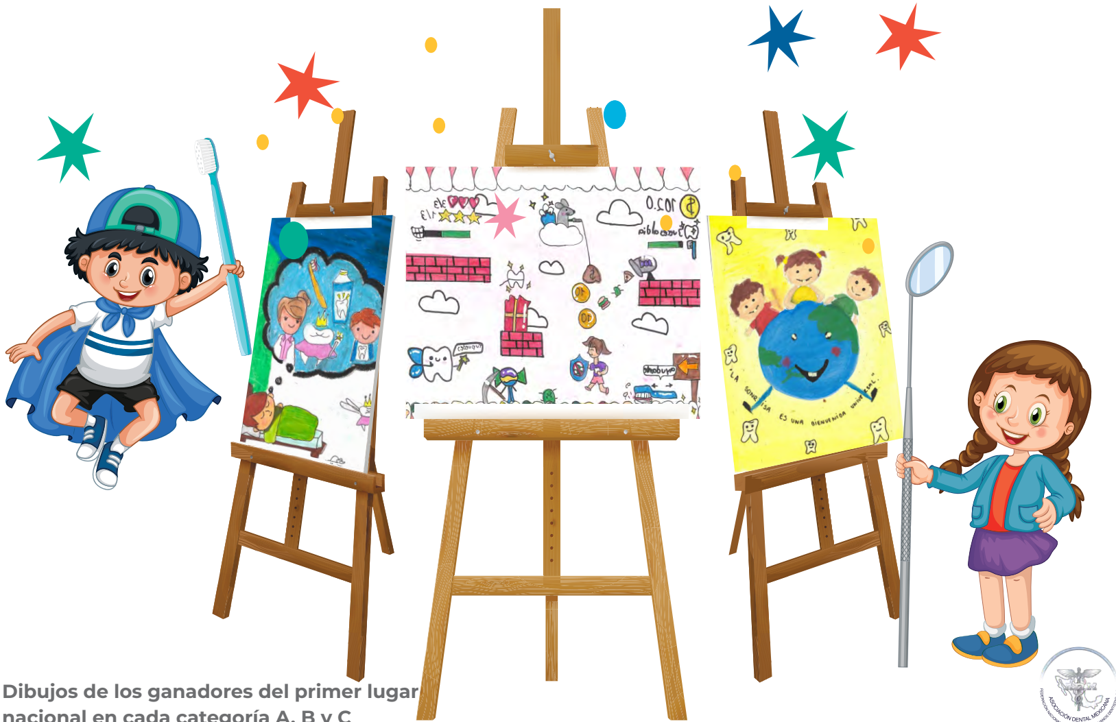
Dibujos de los ganadores del primer lugar nacional en cada categoría A, B y C