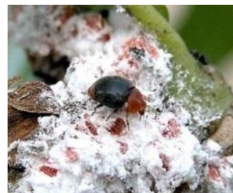
Figura 2. Cryptolaemus montrouzieri