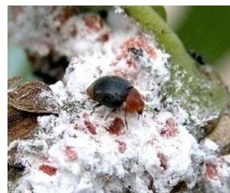
Figura 2. Cryptolaemus montrouzieri