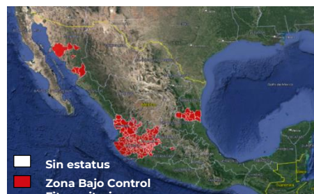
Figura 1. Estatus fitosanitario de plagas reglamentadas del agave en el mes de octubre de 2023.

Jalisco: todo el Estado; Guanajuato: Abasolo, Ciudad Manuel Doblado, Cuerámara, Huanímaro, Pénjamo, Purísima del Rincón y Romita; Michoacán: Briseñas de Matamoros, Chavinda, Chilchota, Churintzio, Cotija, Ecuandureo, Jacona, Jiquilpan, Maravatío, Marcos Castellanos, Nuevo Parangaricutiro, Numarán, Pajacuarán, Peribán, La Piedad, Cojumatlán de Régules, Los Reyes, Sahuayo, Tancítaro, Tangamandapio, Tangancícuaro, Tanhuato, Tingüindín, Tocumbo, Venustiano Carranza, Villamar, Vistahermosa, Yurécuaro, Zamora y Zináparo; Nayarit: Ahuacatlán, Amatlán de Cañas, Ixtlán, Jala, San Pedro de Lagunillas, Santa María del Oro, Tepic y Xalisco; Tamaulipas: Aldama, Altamira, Antigua Morelos, Gómez Farías, González, Llera, Mante, Nuevo Morelos, Ocampo, Tula y Xicoténcatl; y Sonora: Hermosillo, Huasabas, Álamos, Etchojoa, Navojoa, Ures y San Pedro de la Cueva (figura 1).