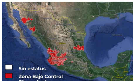
Figura 1. Estatus fitosanitario de plagas reglamentadas del agave en el mes de octubre de 2023.

Jalisco: todo el Estado; Guanajuato: Abasolo, Ciudad Manuel Doblado, Cuerámaro, Huanímaro, Pénjamo, Purísima del Rincón y Romita; Michoacán: Briseñas de Matamoros, Chavinda, Chilchota, Churintzio, Cotija, Ecuandureo, Jacona, Jiquilpan, Maravatío, Marcos Castellanos, Nuevo Parangaricutiro, Numarán, Pajacuarán, Peribán, La Piedad, Cojumatlán de Régules, Los Reyes, Sahuayo, Tancítaro, Tangamandapio, Tangancícuaro, Tanhuato, Tingüindín, Tocumbo, Venustiano Carranza, Villamar, Vistahermosa, Yurécuaro, Zamora y Zináparo; Nayarit: Ahuacatlán, Amatlán de Cañas, Ixtlán, Jala, San Pedro de Lagunillas, Santa María del Oro, Tepic y Xalisco; Tamaulipas: Aldama, Altamira, Antigua Morelos, Gómez Farías, González, Llera, Mante, Nuevo Morelos, Ocampo, Tula y Xicoténcatl; y Sonora: Hermosillo, Huasabas, Álamos, Etchojoa, Navojoa, Ures y San Pedro de la Cueva (figura 1).