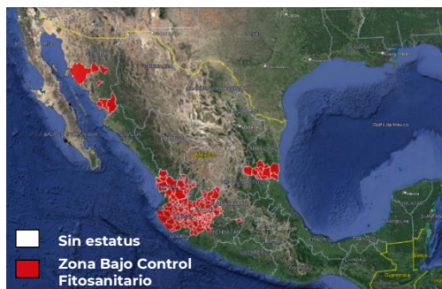
Figura 1. Estatus fitosanitario de plagas reglamentadas del agave en el mes de julio de 2023.