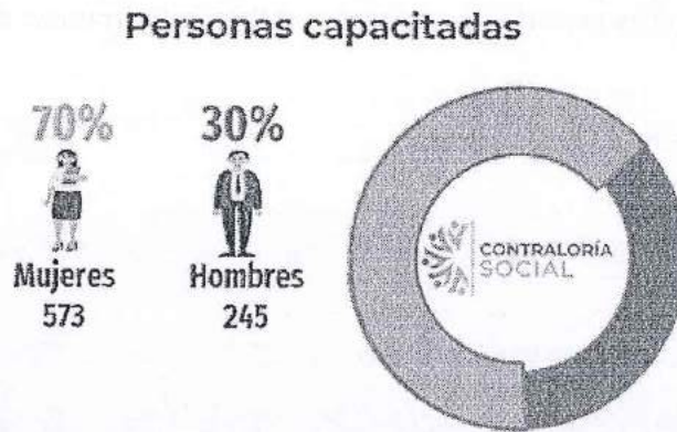
Gráfica 2. Personas capacitadas integrantes de los Comités de Contraloría Social del Programa de Vivienda Social durante el cuarto trimestre del ejercicio fiscal 2023.