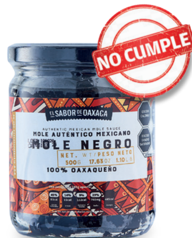
EL SABOR DE OAXACA

Es obligatorio que las instrucciones sean parte de la Información al Consumidor, por lo que al no presentarlas este producto incumple la Norma Oficial Mexicana*.