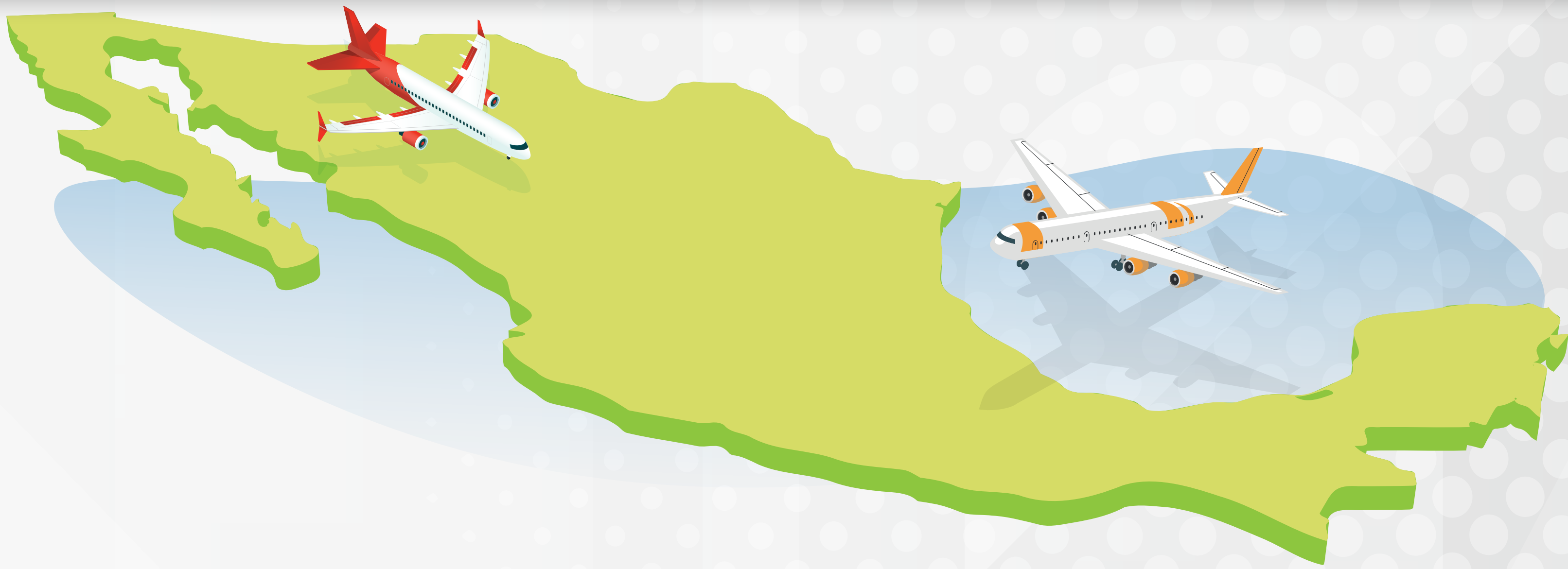
TABLA DE COSTOS DE PAGO DE DERECHOS INTERNACIÓN VÍA AÉREA