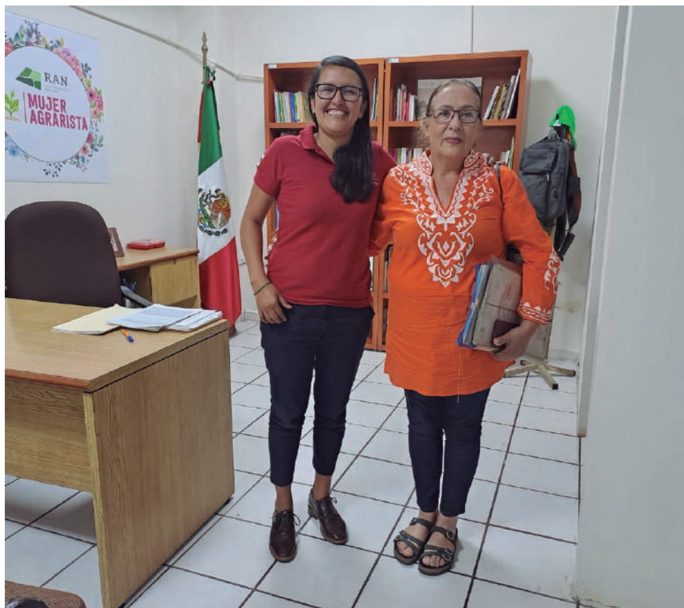
El RAN facilita el acceso de las mujeres a los trámites patrimoniales y de tenencia de la tierra, para poner en orden sus posesiones y evitar despojos e injusticias.