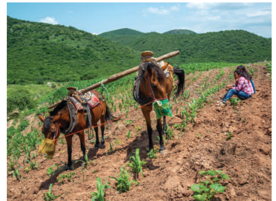
Nietas de Inés Rincón cuidan las yuntas, Tilapa, Puebla.