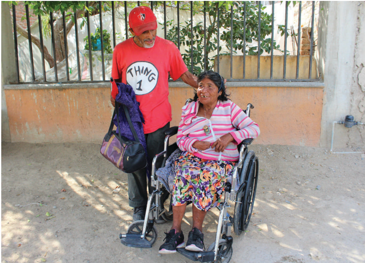
Es necesario equilibrar las cargas del cuidado en los hogares.