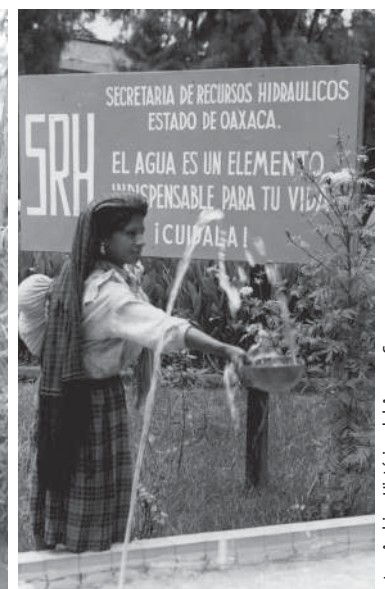
Históricamente, las mujeres han sido las encargadas de abastecer de agua a sus comunidades rurales, al recolectar y administrar el recurso.