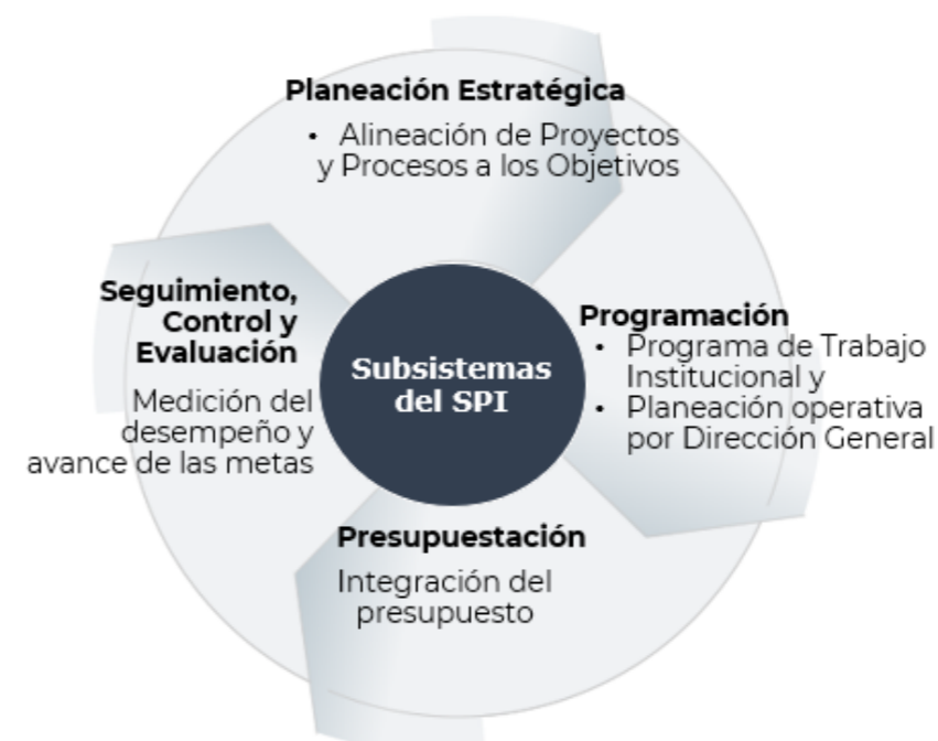
Fig. 1. Subsistemas de Planeación y Operación Elaboración propia.

El Sistema establece los niveles de planeación: Estratégico, Programático y Operativo, así como los responsables de cada uno de ellos y está integrado por los siguientes 4 subsistemas: