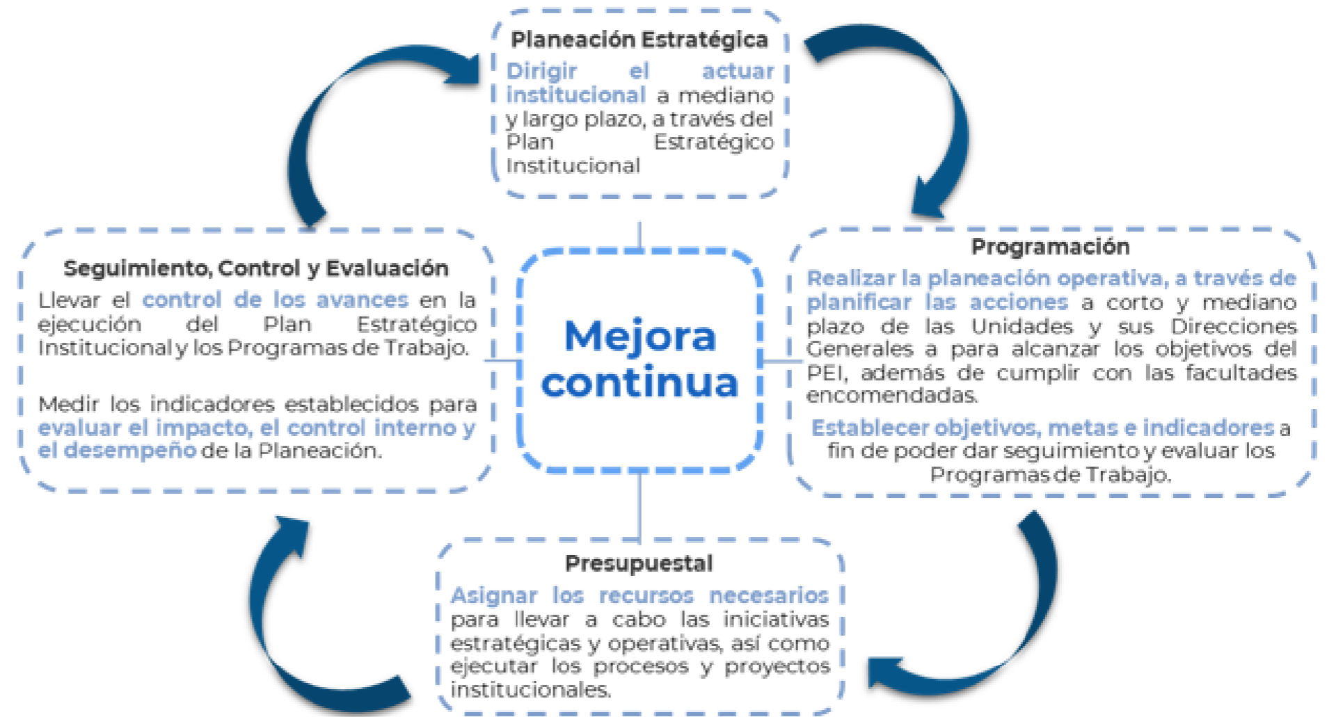
Fig. 3. Subsistemas de Planeación Elaboración propia

En este subsistema se deberá formalizar el Plan Estratégico Institucional (Nivel 1).