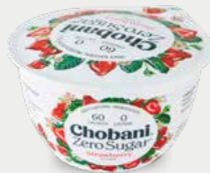
CHOBANI Yogur griego sin azúcar, sabor fresa