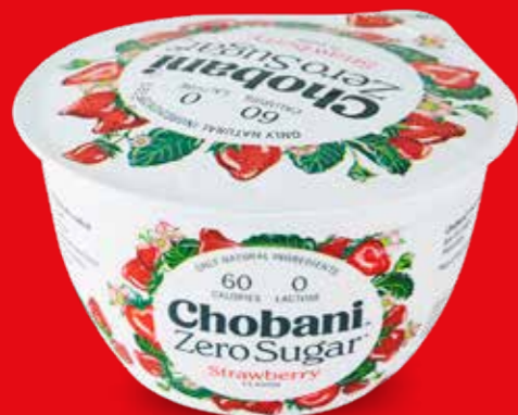
CHOBANI ZERO SUGAR

CONTIENE EDULCORANTES, NO RECOMENDABLE EN NIÑOS