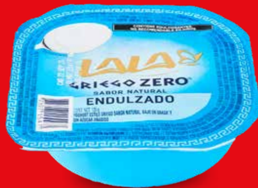
LALA GRIEGO ZERO