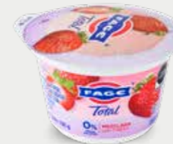
FAGE Yogurt natural griego, sin grasa, mezclado con preparado de fresa