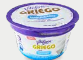
VITALÍNEA Yogur griego sabor endulzado, deslactosado, bajo en grasa