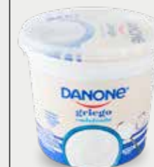
DANONE Yogur griego sabor endulzado, deslactosado, bajo en grasa