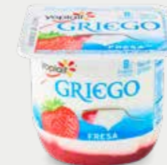
YOPLAIT Yogur estilo griego con fresa, bajo en grasa