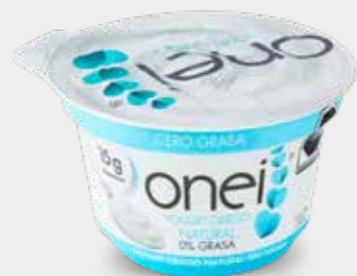
ONEI Yogur griego natural sin grasa

Lactobacillus paracasei / Lactobacillus acidophilus / Bifidobacterium animalis / Lactobacillus rhamnosus