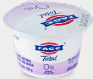
FAGE Yogur natural griego, sin grasa