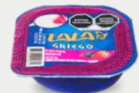
LALA GRIEGO FRUTOS ROJOS Yogur estilo griego con fresa, frambuesa y zarzamora