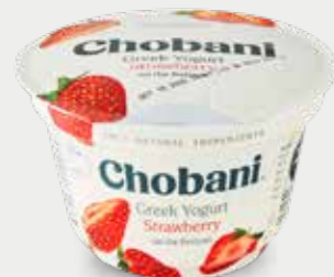
CHOBANI Yogur sin grasa con fresa en el fondo, 0% grasa de leche

Lactobacillus paracasei / Lactobacillus acidophilus / Bifidobacterium animalis / Lactobacillus rhamnosus