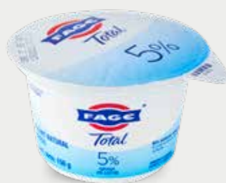
FAGE Yogur natural griego

Lactobacillus acidophilus / Bifidus / Lactobacillus casei