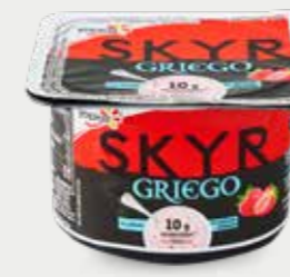
YOPLAIT SKYR GRIEGO Yogur griego con 6.6% de fresa, deslactosado, sin grasa, sin azúcares añadidos, reducido en calorías, tipo skyr