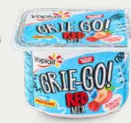
YOPLAIT GRIE-GO! RED MIX Yogur griego con 6.1% de frutos rojos, bajo en grasa, reducido en azúcar