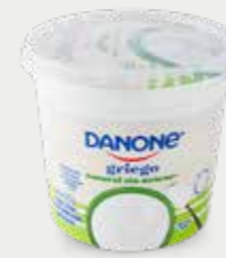
DANONE Yogur griego natural, deslactosado, bajo en grasa