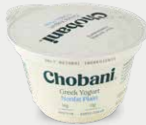
CHOBANI Yogur sin Grasa Natural, 0% Grasa de Leche

Lactobacillus acidophilus / Bifidus / Lactobacillus casei