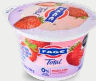
FAGE Yogur natural griego sin grasa, mezclado con preparado de fresa