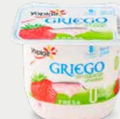
YOPLAIT Yogur estilo griego bajo en grasa sin azúcares añadidos, con fresa