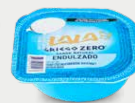
LALA Yogur estilo griego sabor natural bajo en grasa y sin azúcar añadido