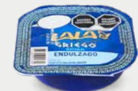
LALA GRIEGO NATURAL Yogur estilo griego natural endulzado