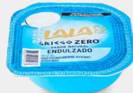
LALA GRIEGO ZERO