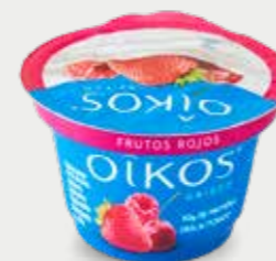
OÍKOS Yogur griego con 3% de fresa, zarzamora, frambuesa y 0.5 g de cereza deslactosado / 150 g