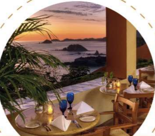
Hoteles y restaurantes