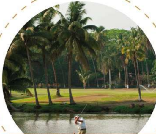
Campos de golf