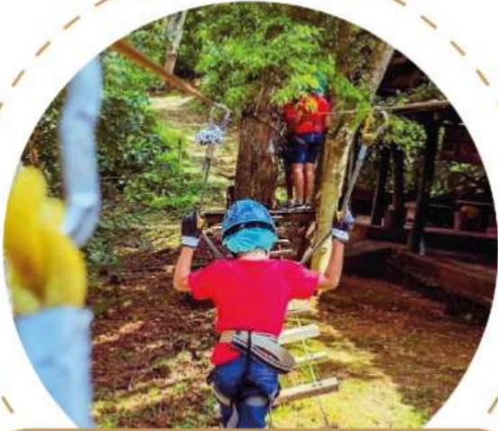
Parque Aventura Ixtapa