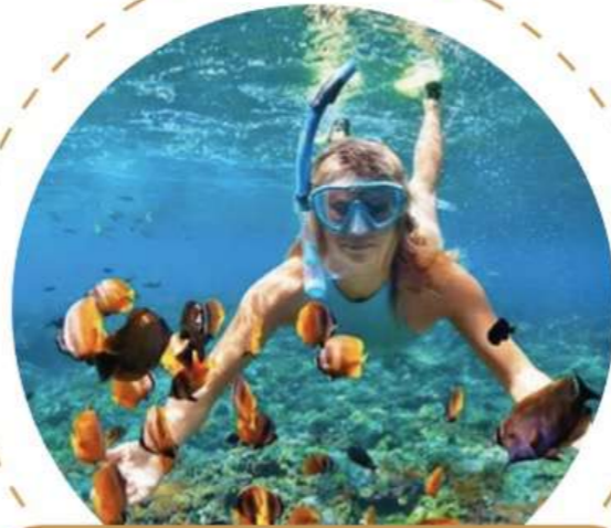
Kayak y snorkel en playa Las Gatas