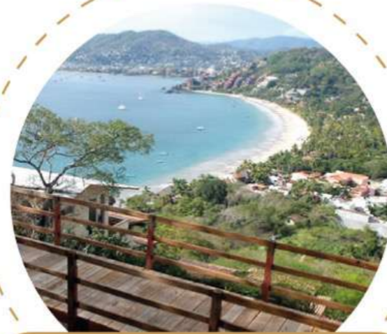
Park Bio La Escollera