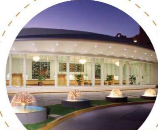
Centro de convenciones