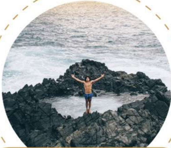
Barra de Potosí