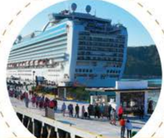
Muelle para cruceros