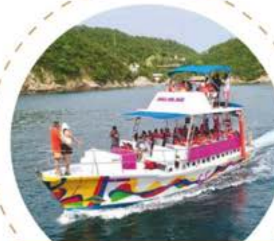
Recorrido por las bahías