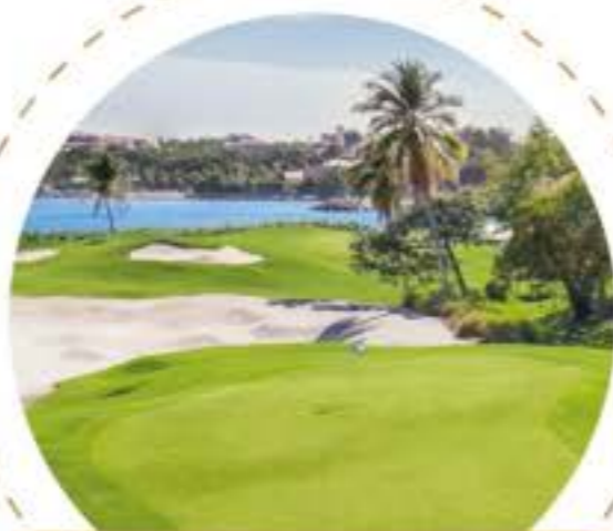
Club de golf Las Parotas