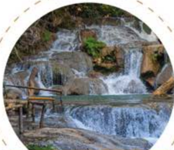
Cascadas Mágicas de Copalitilla

¿Qué visitar en las bahías de Huatulco ?