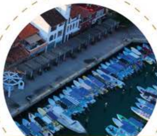
Marina Dársena Santa Cruz