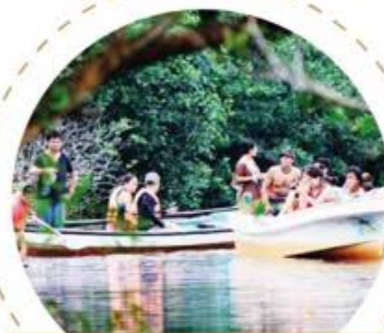
Excursión ecológica sobre tortugas y cocodrilos