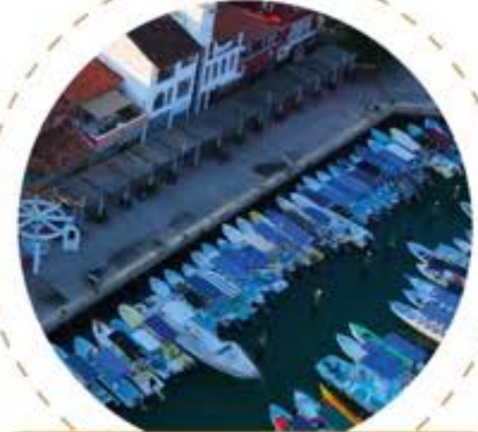
Marina Dársena Santa Cruz