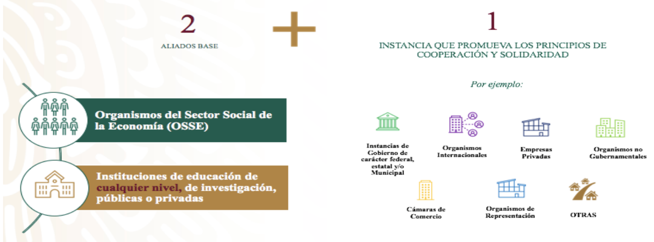
Ilustración 1 Tipos de actores que integran Pre-NODESS