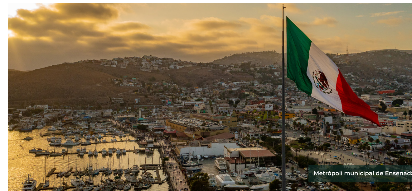
Metrópoli municipal de Ensenada

Sin duda alguna, las metrópolis constituyen un importante activo para el desarrollo nacional, un reto para el ordenamiento territorial, la planeación, el desarrollo urbano y la coordinación metropolitana. El presente ejercicio será de utilidad para la planeación metropolitana ante los retos asumidos por México en el marco de los Objetivos de Desarrollo Sostenible (ODS) 2030, la Nueva Agenda Urbana y el Consenso de Montevideo sobre Población y Desarrollo. No hay duda de que la población metropolitana seguirá creciendo y que el ordenamiento territorial y la concurrencia de las políticas públicas de los tres órdenes de gobierno deberán implementar medidas efectivas a su favor.