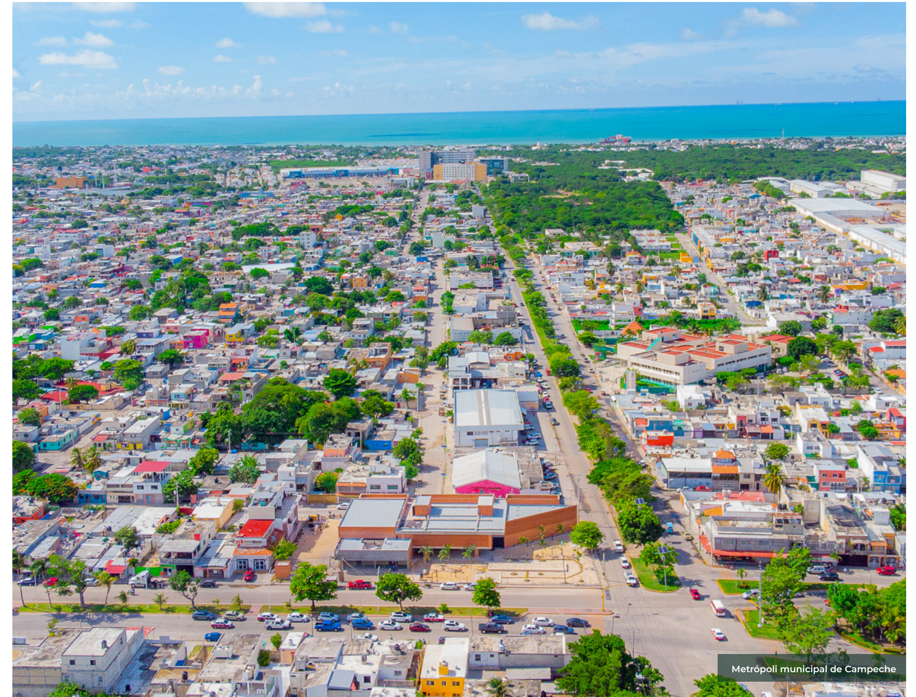
Metrópoli municipal de Campeche

Identificación, delimitación y caracterización de las metrópolis en México