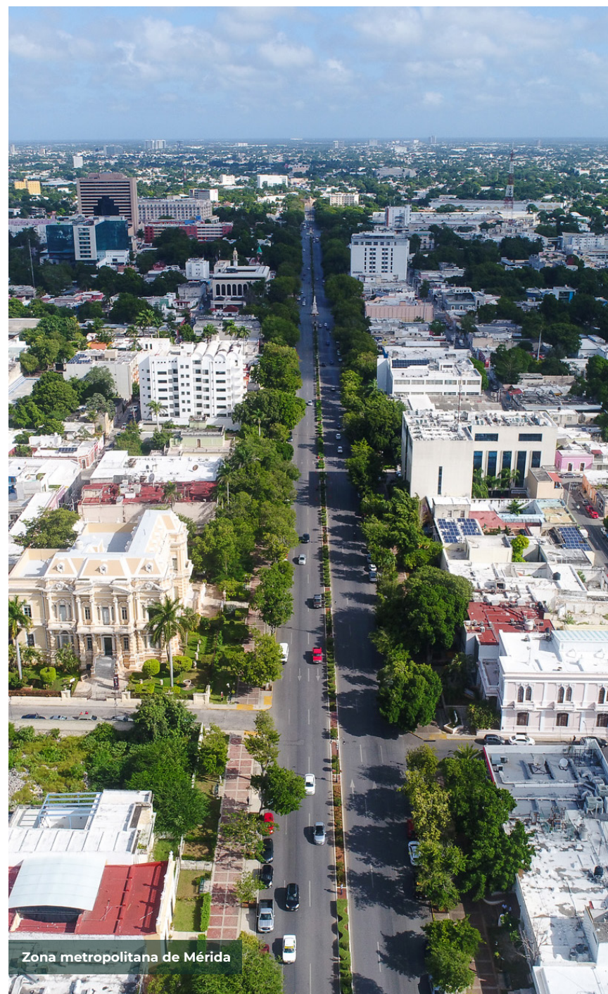
Zona metropolitana de Mérida