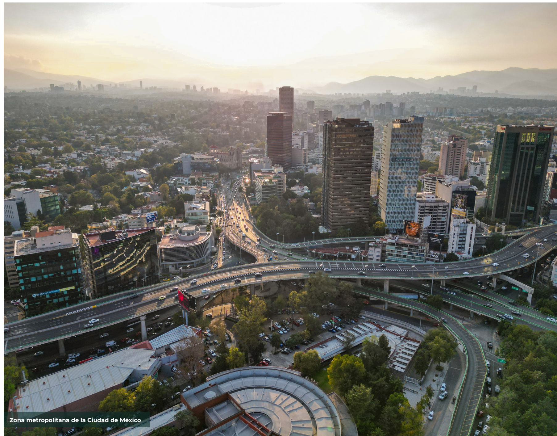
Zona metropolitana de la Ciudad de México