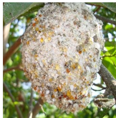
Figura 2. Cultivo de guanábana con presencia de cochinilla rosada