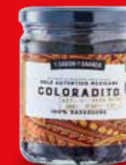
EL SABOR DE OAXACA