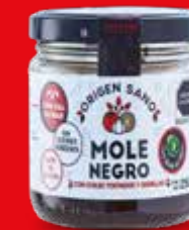
ORIGEN SANO MOLE NEGRO