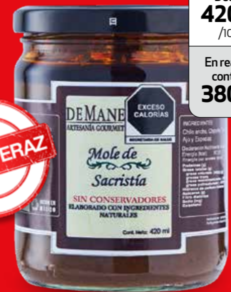
DEMANE ARTESANÍA GOURMET