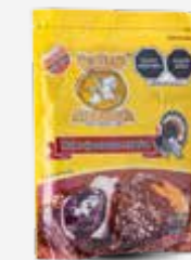
MOLE DON PANCHO MOLE ROJO ATOCPAN EN POLVO