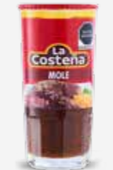
LA COSTEÑA MOLE