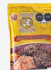
MOLE DON PANCHO MOLE ESPECIAL ROJO ALMENDRADO EN POLVO