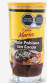
DOÑA MARÍA MOLE POBLANO CON CACAO