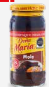
DOÑA MARÍA MOLE