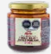
DOÑA MARÍA MOLE ROJO ESTILO POBLANO