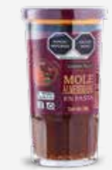
GOLDEN HILLS MOLE ALMENDRADO EN PASTA