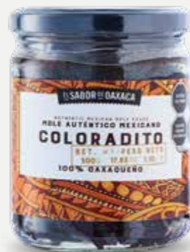
EL SABOR DE OAXACA