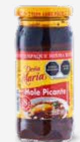
DOÑA MARÍA MOLE PICANTE