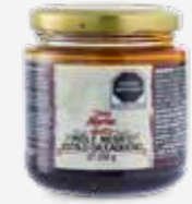
DOÑA MARÍA MOLE NEGRO ESTILO OAXAQUEÑO