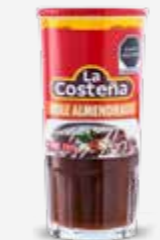
LA COSTEÑA MOLE ALMENDRADO