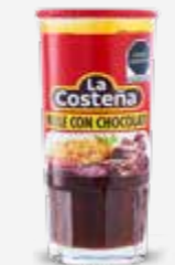
LA COSTEÑA MOLE CON CHOCOLATE