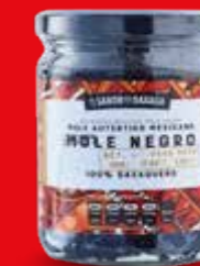
EL SABOR DE OAXACA MOLE NEGRO