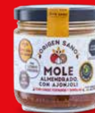
ORIGEN SANO MOLE ALMENDRADO