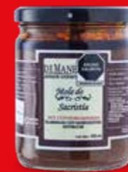
DEMANE ARTESANÍA GOURMET