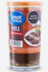
GREAT VALUE MOLE ALMENDRADO