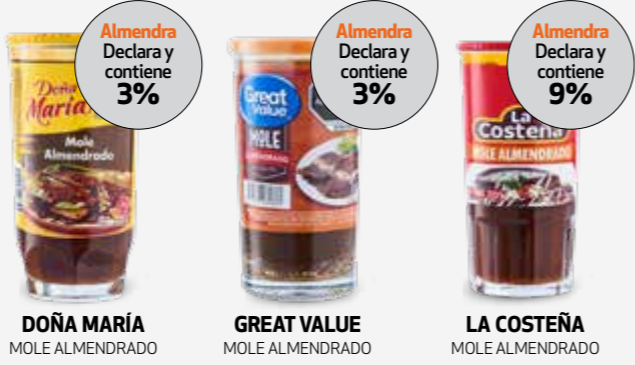
DOÑA MARÍA MOLE ALMENDRADO

Hay productos que se denominan "mole almendrado", y aunque no hay un mínimo establecido de este fruto seco que debieran contener sí deben declarar cuánto contienen, tal es el caso de: