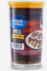
GREAT VALUE MOLE POBLANO