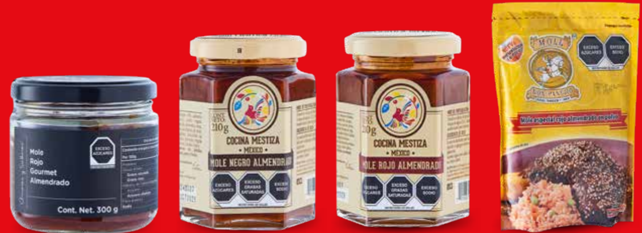
AMORES Y SABORES