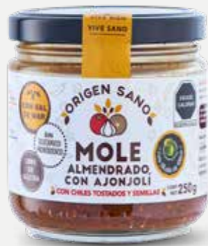
ORIGEN SANO MOLE ALMENDRADO CON AJONJOLÍ