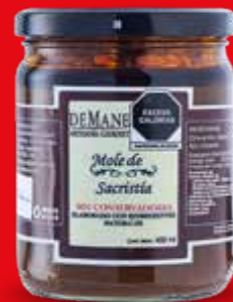
DEMANE ARTESANÍA GOURMET