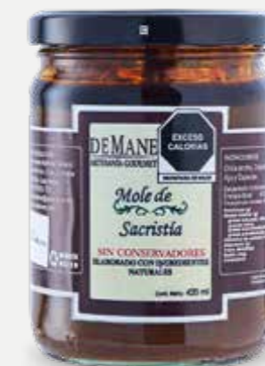
DEMANE ARTESANÍA GOURMET