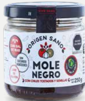
ORIGEN SANO MOLE NEGRO