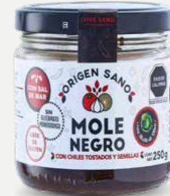
ORIGEN SANO MOLE NEGRO