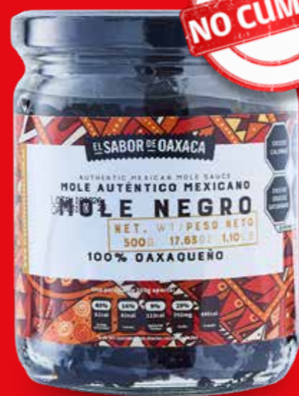
EL SABOR DE OAXACA

Es obligatorio que las instrucciones sean parte de la Información al Consumidor, por lo que al no presentarlas este producto incumple la Norma Oficial Mexicana*.