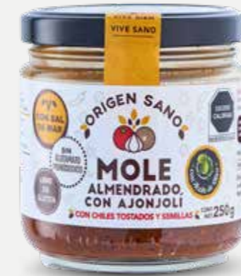
ORIGEN SANO MOLE ALMENDRADO CON AJONJOLÍ