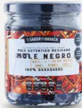
EL SABOR DE OAXACA MOLE NEGRO