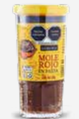
GOLDEN HILLS MOLE ROJO EN PASTA