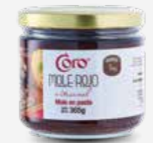
CORO MOLE ROJO ARTESANAL