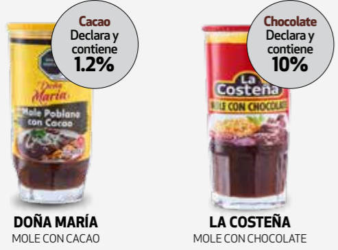
DOÑA MARÍA MOLE CON CACAO

Hay productos que contienen chocolate o cacao y en algunos casos forman parte de su denominación. Aunque no hay un mínimo de cuánto deben contener sí deben declarar la cantidad, tal es el caso de: