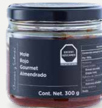
AMORES Y SABORES