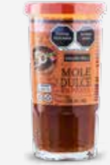
GOLDEN HILLS MOLE DULCE EN PASTA