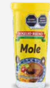
ROGELIO BUENO MOLE NEGRO