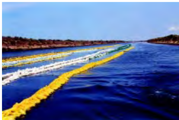
Figura 2 Las raas de cultivo deberán estar libres de peligros biológicos y peligros químicos.

minimicen la posibilidad de riesgos de contaminación en estos productos.