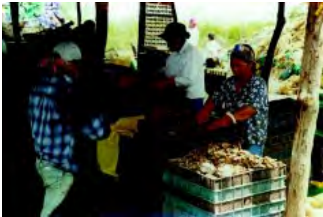
Figura 14 Considerar la higiene del personal, del equipo de recolección y de las instalaciones durante la cosecha.

■ El personal que participa en la cosecha, deberá cumplir con las observaciones de buenas prácticas de higiene descritas anteriormente. Se debe prohibir el uso de todo tipo de joyas, adornos, relojes, maquillaje, etc.; así como fumar, comer y escupir en las áreas de trabajo (Figura 14).