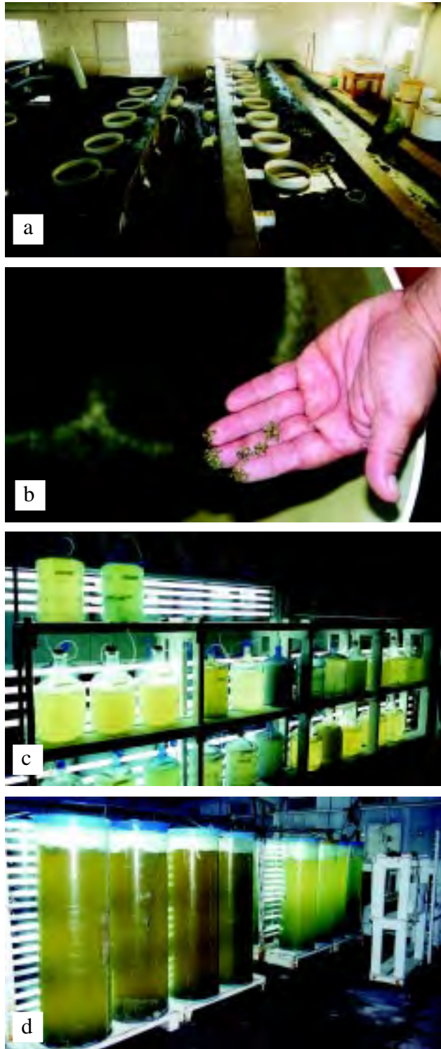
Figura 12 Sistema de producción de semillas de ostia del pacífico y cultivo de microalgas a diferentes volúmenes en el Laboratorio de Producción del Instituto de Acuicultura del Estado de Sonora. a) área de fijación de la larva, b) semillas, c) garrafones y d) columnas.

cloro a una concentración de 2 ppm, el cual posteriormente es neutralizado con tiosulfato de sodio. El cloro es efectivo para destruir a la mayoría de los microorganismos que son patógenos a algas y/o larvas. Los compuestos de cloro se pueden usar en la forma de cloro libre, hipoclorito de sodio, blanqueadores caseros a base de hidróxido de sodio, o hipoclorito de calcio.