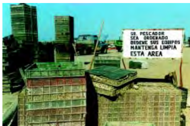
Figura 8 Mantener las instalaciones ordenadas e higiénicas, evita la presencia de plagas.

■ Si es necesario la aplicación de cualquier sustancia para el control o eliminación de plagas en cualquier parte del proceso, ésta debe realizarse por personal capacitado y cumplir con las especificaciones establecidas en el catálogo oficial de plaguicidas vigente del CICOPLAST.