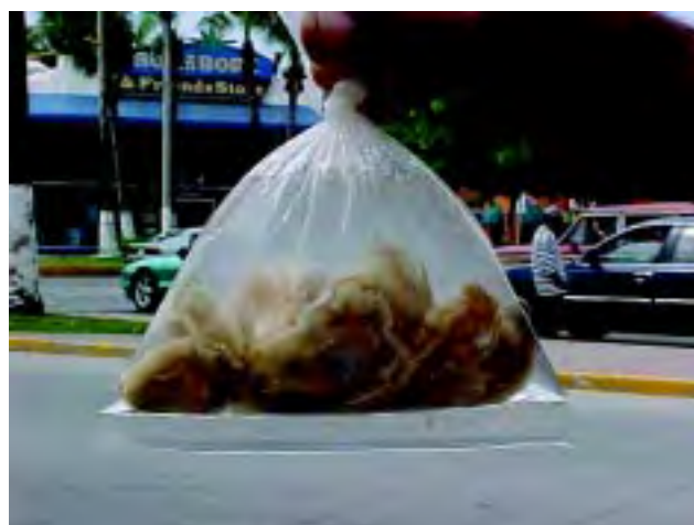
Figura 1 Venta de ostiones de dudosa procedencia en la vía pública.