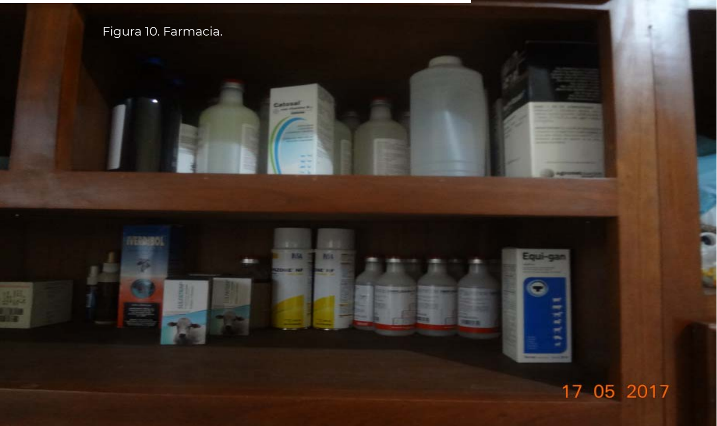
Figura 10. Farmacia.