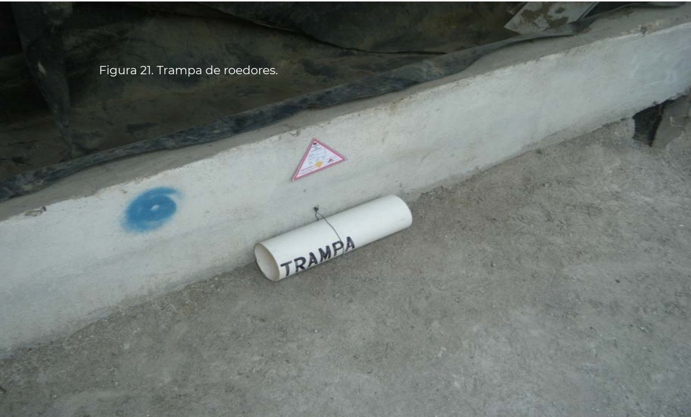
Figura 21. Trampa de roedores.

en las granjas de aves o de cerdos, en donde se aplican controles muy estrictos para protección de los animales y su ambiente.