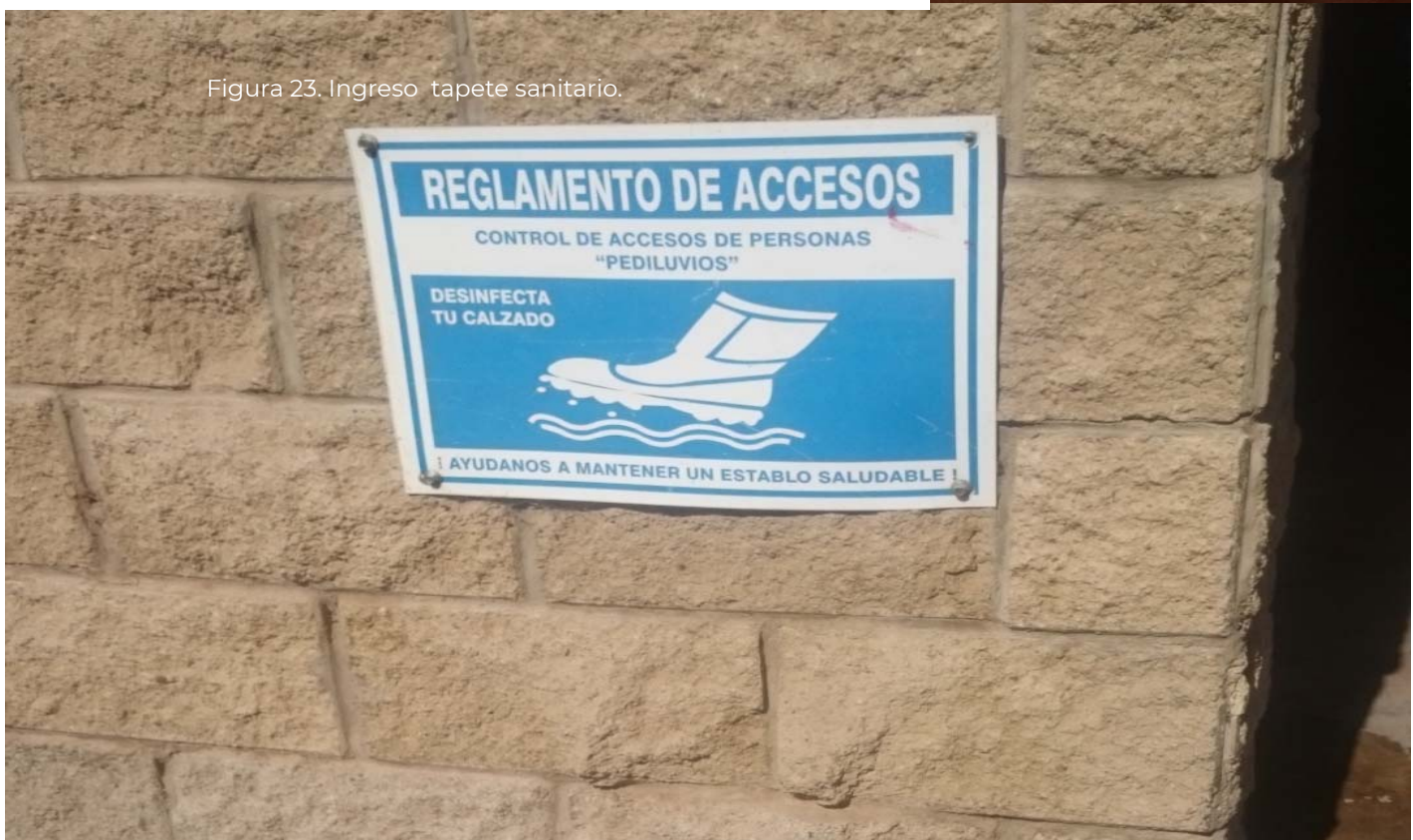
Figura 23. Ingreso tapete sanitario.