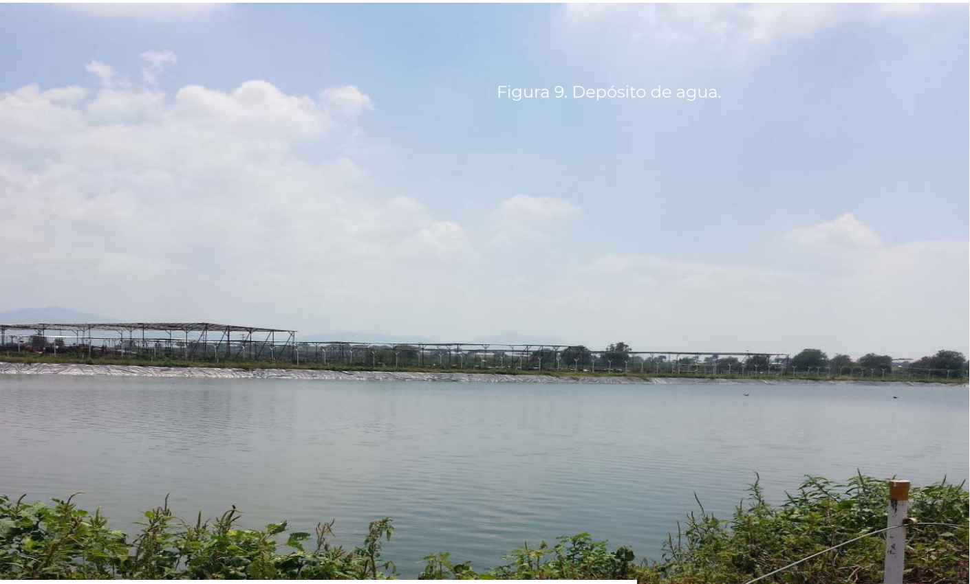
Figura 9. Depósito de agua.