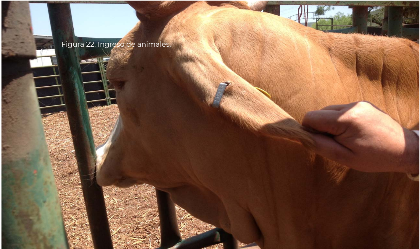
Figura 22. Ingreso de animales.