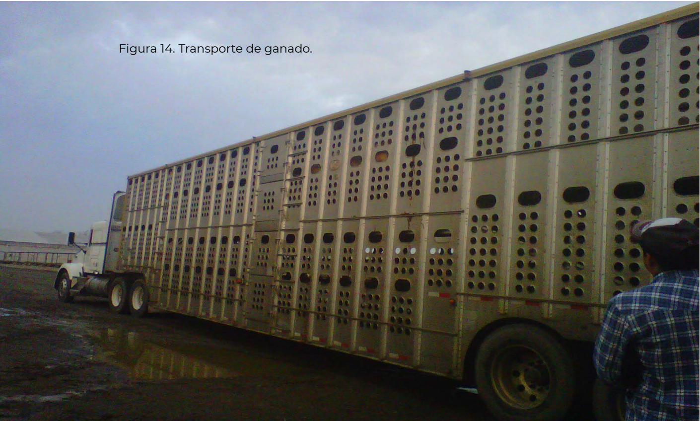
Figura 14. Transporte de ganado.