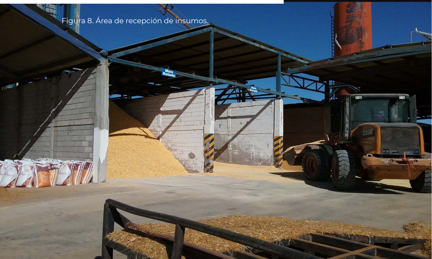
Figura 8. Área de recepción de insumos.