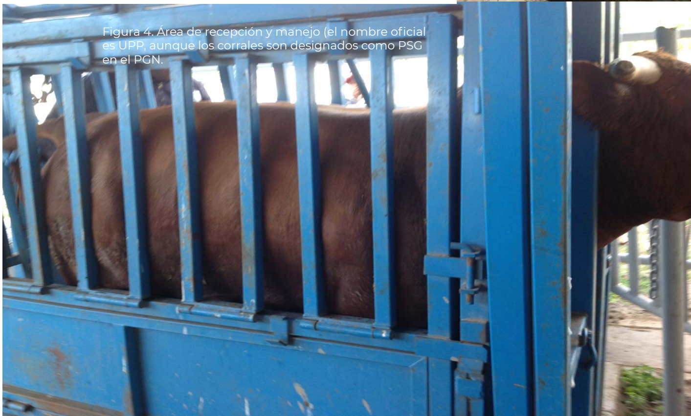
Figura 4. Área de recepción y manejo (el nombre oficial es UPP, aunque los corrales son designados como PSG en el PGN).