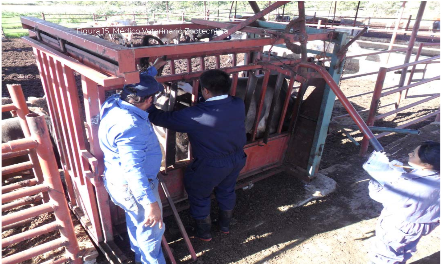
Figura 15. Médico Veterinario Zootecnista.