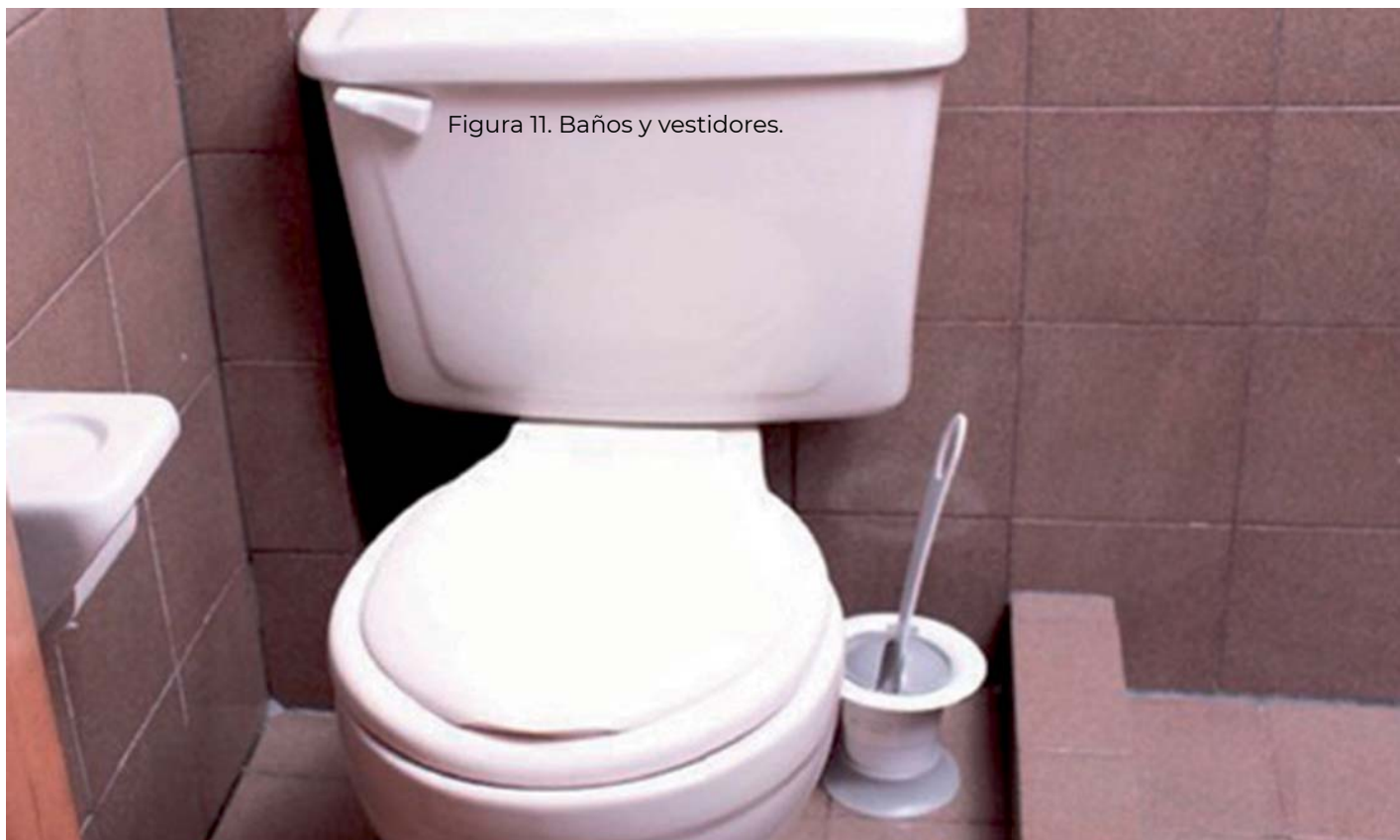
Figura 11. Baños y vestidores.