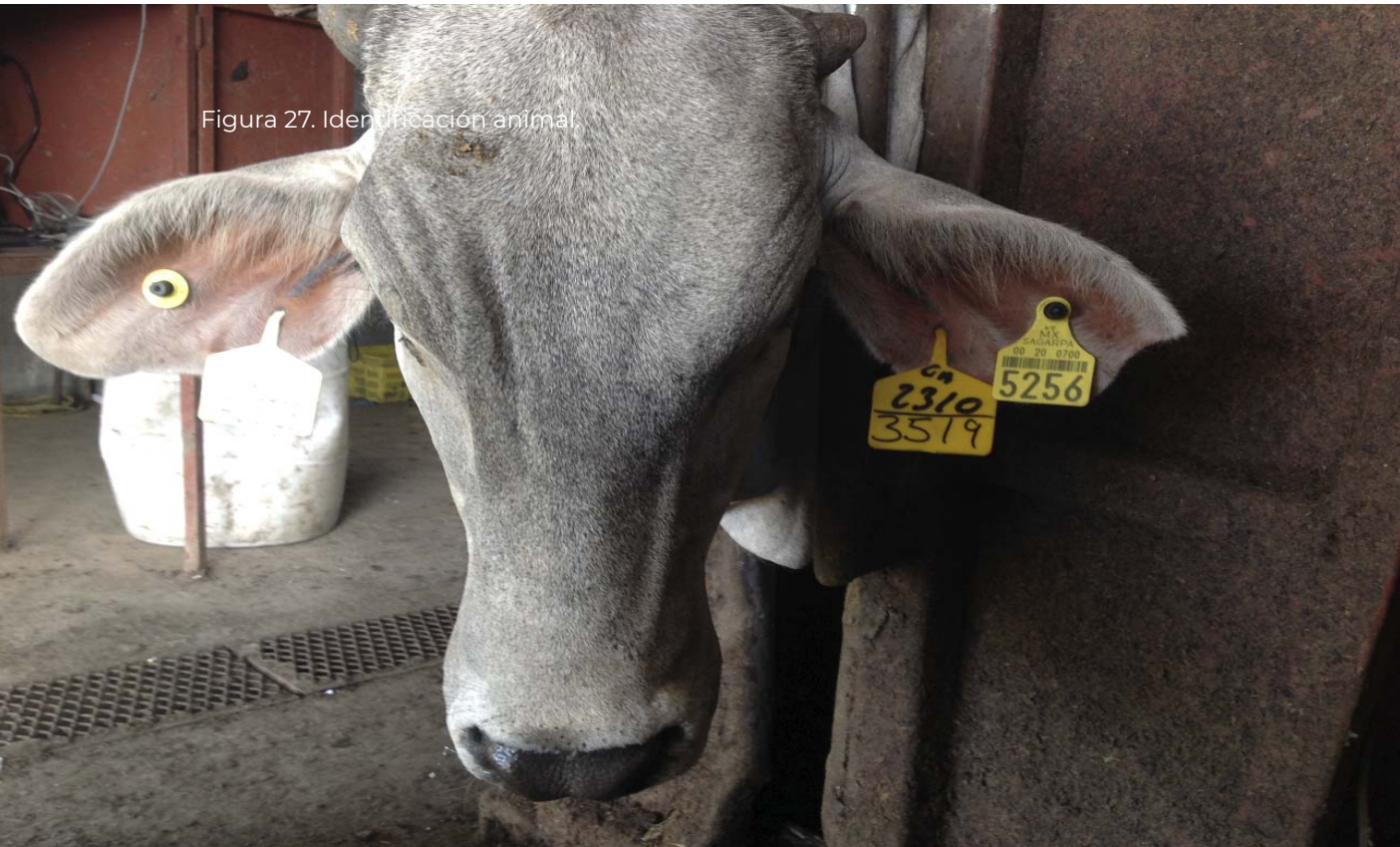
Figura 27. Identificación animal.

Animal para Bovinos y Colmenas (Fig. 27).