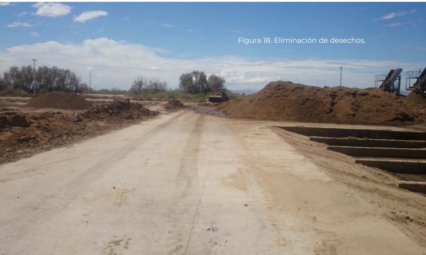
Figura 18. Eliminación de desechos.