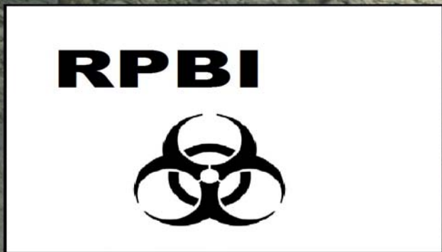
Figura 19. Manejo de desechos veterinarios.