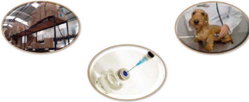
Figura 16. Regulación de productos veterinarios.