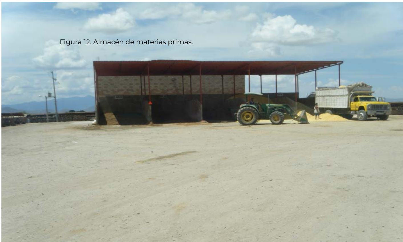
Figura 12. Almacén de materias primas.

Además de contar con un laboratorio de control de calidad interno, el cual deberá estar autorizado o aprobado por la Secretaría y en el caso de no contar con él o en su caso no estar dentro del supuesto mencionado; debe demostrar que los análisis de control de calidad se realizan en un laboratorio autorizado o aprobado ( https://www.gob.mx/senasica/acciones-y-programas/laboratorios-de-salud-animal ).