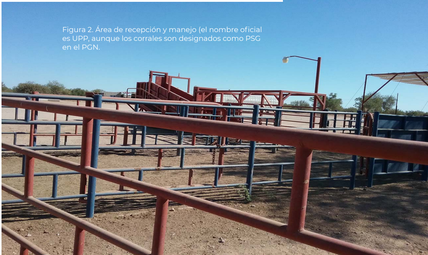
Figura 2. Área de recepción y manejo (el nombre oficial es UPP, aunque los corrales son designados como PSG en el PGN).