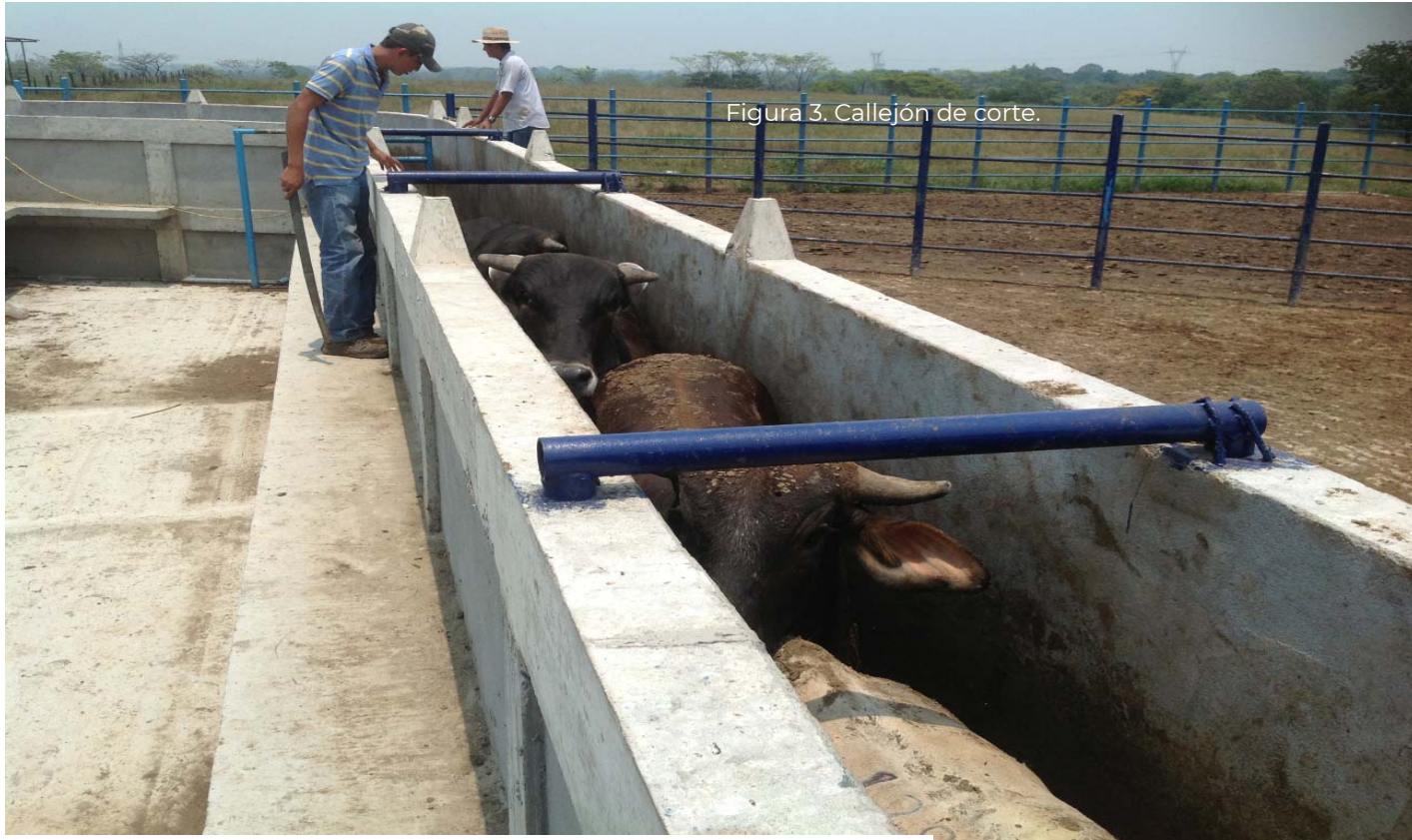
Figura 3. Callejón de corte.