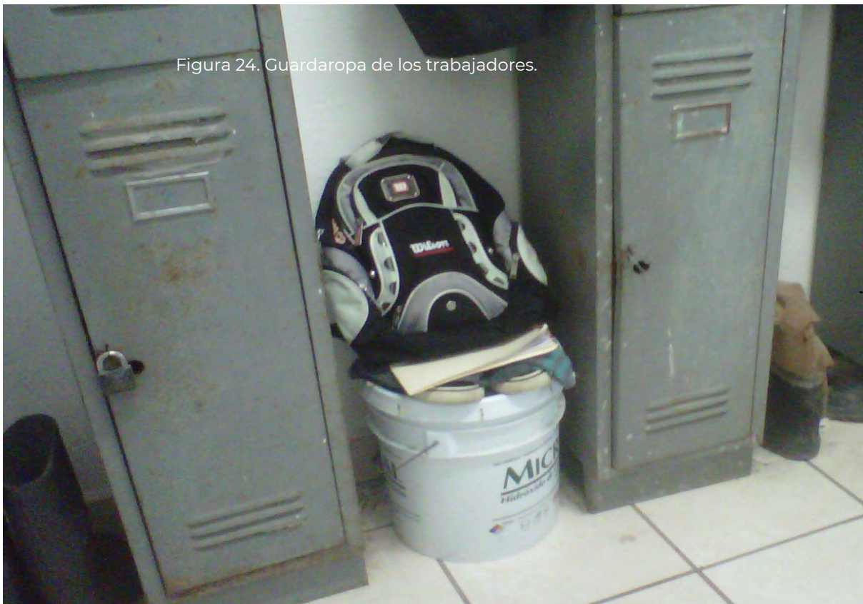
Figura 24. Guardarropa de los trabajadores.