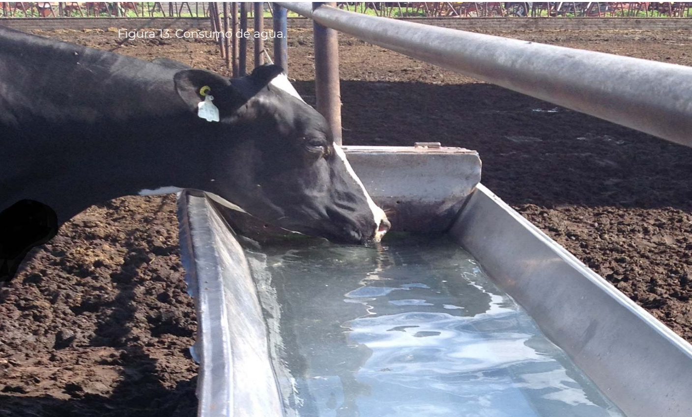
Figura 13. Consumo de agua.