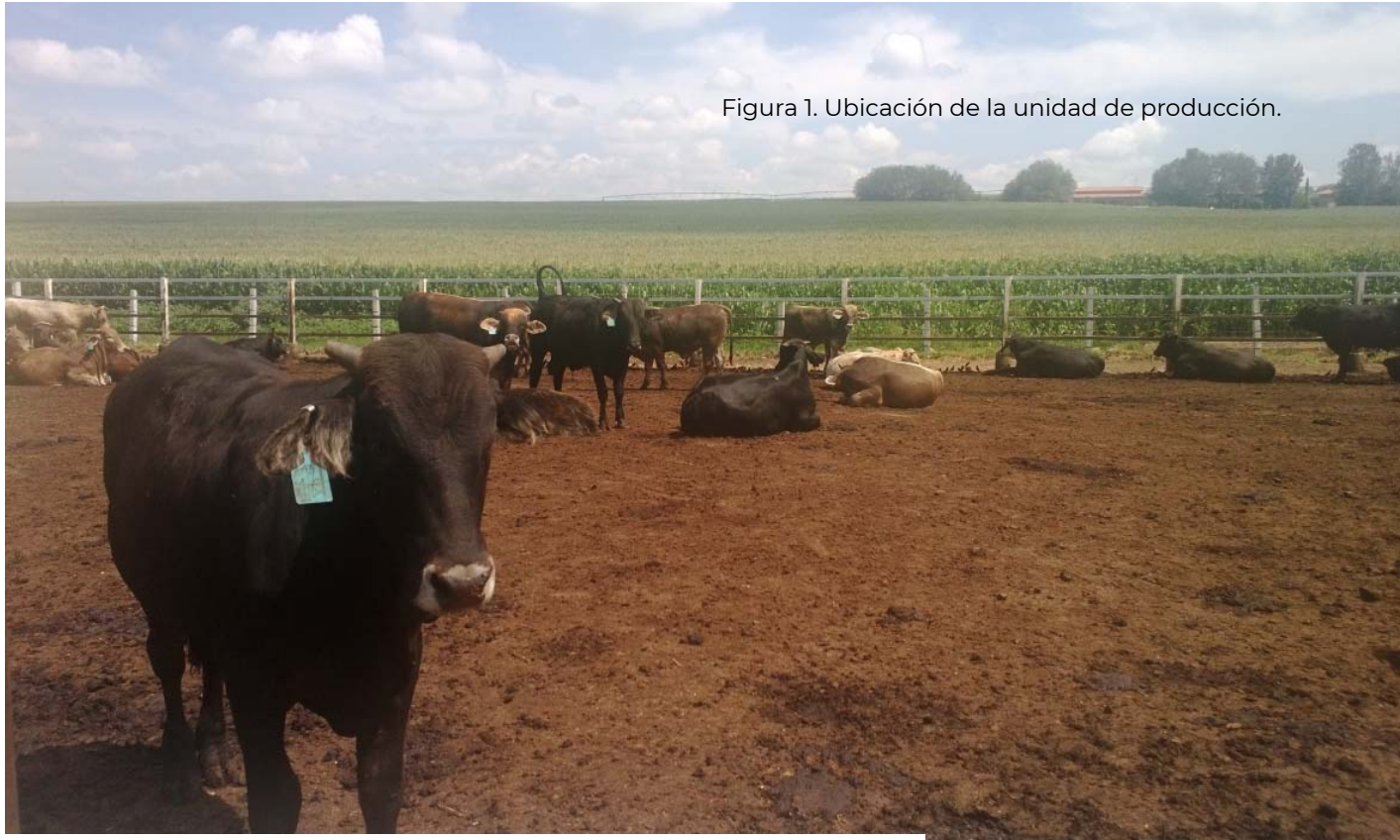
Figura 1. Ubicación de la unidad de producción.