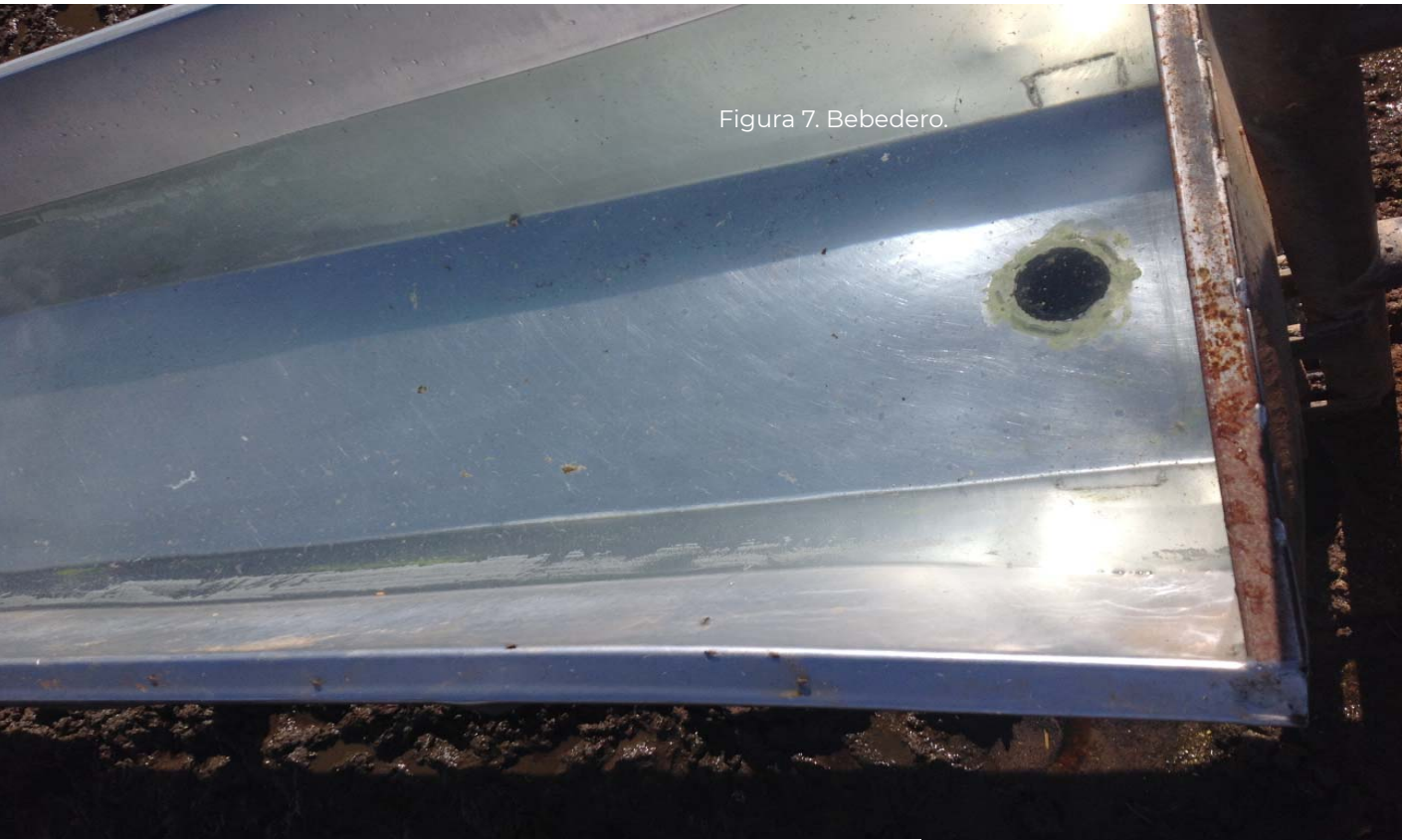
Figura 7. Bebedero.