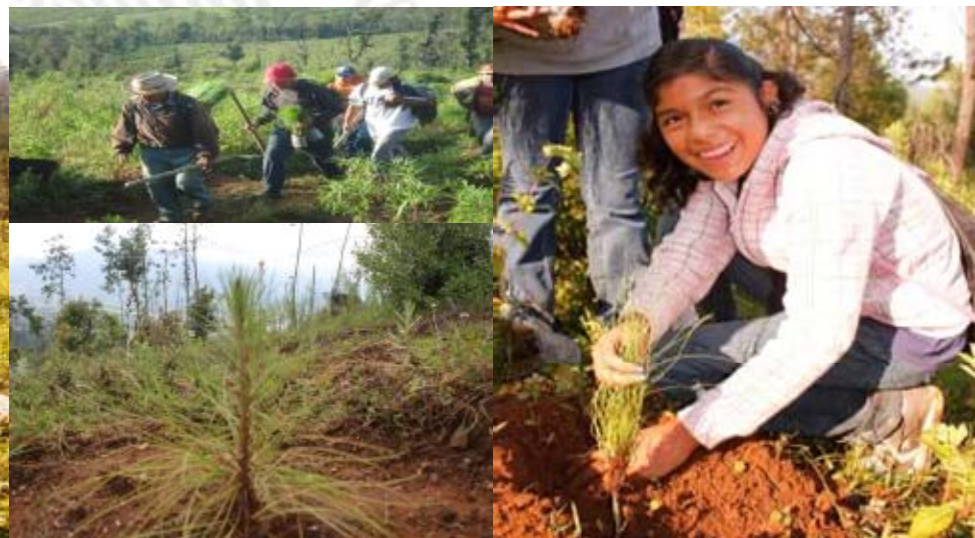
Actualmente en proceso de restauración