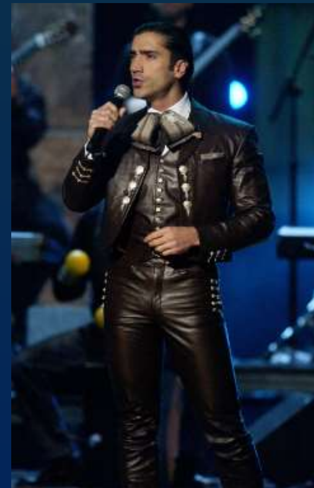
CONCIERTO ALEJANDRO FERNÁNDEZ