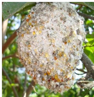
Figura 2. Cultivo de guanábana con presencia de cochinilla rosada