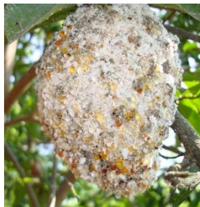
Figura 2. Cultivo de guanábana con presencia de cochinilla rosada