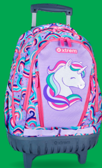
XTREME BY SAMSONITE

Los siguientes modelos tienen ruedas, lo que hace que no se puedan llevar en la espalda: