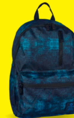
XTREME BY SAMSONITE