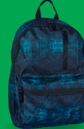
XTREME BY SAMSONITE