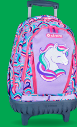
XTREME BY SAMSONITE