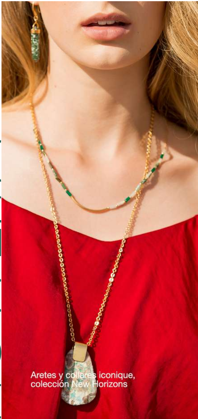
Aretes y collares iconique, colección New Horizons