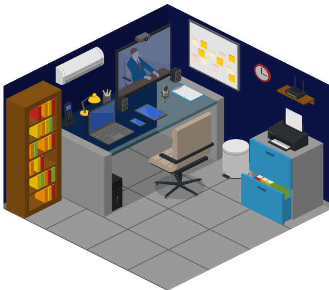
Tabla 1. Componentes Tecnológicos y Colaborativos. Fuente propia

A continuación, se representa de manera gráfica la integración de los Componentes tecnológicos y colaborativos con la infraestructura y mobiliario requerido para el servicio de seguimiento a distancia. (Ilustración 1)