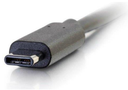
Ilustración 2 USB-C