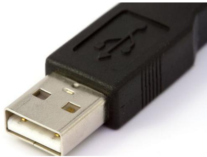
Ilustración 1 USB-A

puerto, no importando la dirección en que se inserte. Tiene velocidades de transferencia, conexión y transmisión de energía más potentes; así como cuenta con una mejor compatibilidad con algunas conexiones como HDMI, Thunderbolt 3, entre otros.