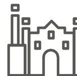
Industrialización y transformación