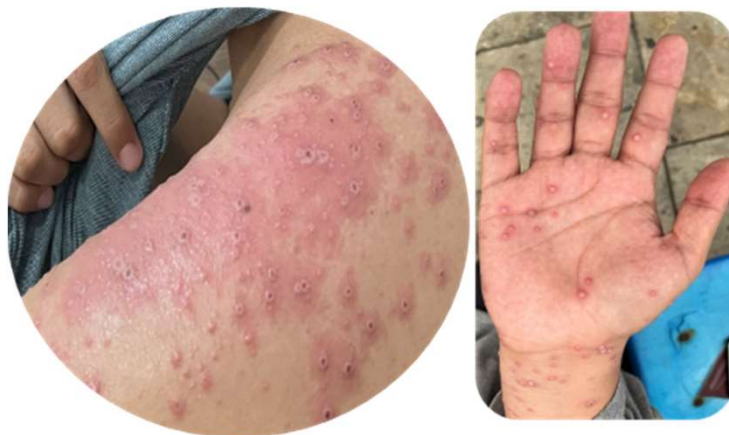
Fig. 1 y 2: Imagen macroscópica de lesiones en palma de la mano y tronco del paciente (Día 6 de evolución). Foto tomada previa autorización del paciente

Posteriormente el día 26 de Julio del 2022 acude nuevamente refiriendo erupción cutánea en algunas áreas donde anteriormente se encontraban vesículas de la región submandibular y dorso de la mano, así como aparición de nuevas lesiones maculo papulares en región frontal, y con fase de costra umbilicada en algunas otras lesiones con las que el paciente había iniciado. Así mismo refiere dolor en las regiones donde cuenta con linfadenopatías. Se decide iniciar con tratamiento tipo Metilprednisolona suspensión inyectable única dosis, y ketorolaco de 30 mg, ampulas una aplicación cada 24 horas por 3 días. Debido a lo anterior se decide interconsulta con servicio de epidemiología, quien evalúa y comenta que paciente es un caso sospechoso de mpox por las lesiones que presenta en el momento (figura 1 y 2), motivo por el cual se decide toma de muestra tipo PCR para mpox en costras y lesiones cutáneas y aislar al paciente hasta contar con resultados de dicha prueba que confirmen o descarten diagnóstico.