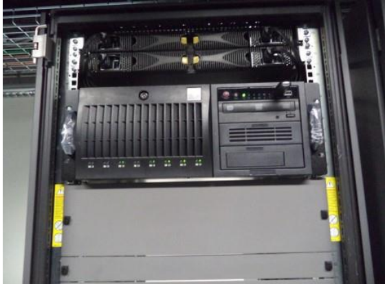
Para las instalaciones de Salvador Novo:

Invitación a cuando menos tres personas nacional electrónica Número Interno ITP-04/2023 No. CompraNet IA-06-A00-006A00996-N-6-2023 "Servicio de Mantenimiento Preventivo y Correctivo al Sistema de Seguridad Física Integral".