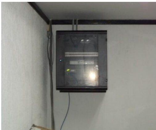
Para las instalaciones de CEDOC: