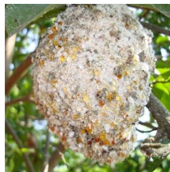
Figura 2. Cultivo de guanábana con presencia de cochinilla rosada