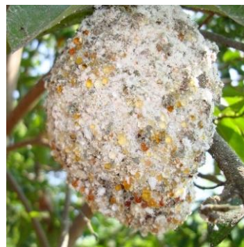
Figura 2. Cultivo de guanábana con presencia de cochinilla rosada